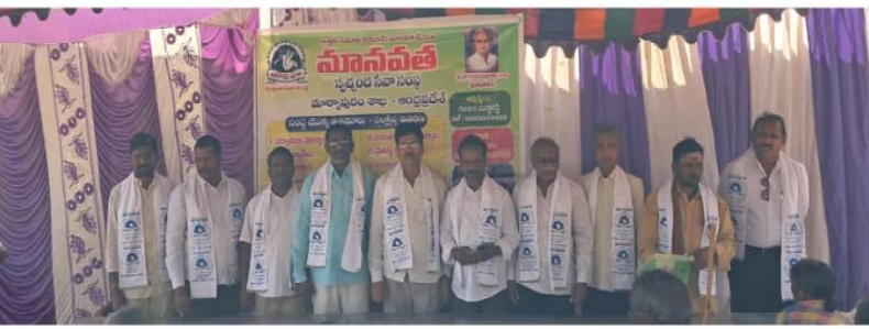
క్రెమ్ కౌంటర్ స్యూస్... మార్కెట్లలో జిల్లా...

మార్కెట్లలో మానవతా స్వచ్ఛంద సేవ సంస్థ ఆధ్వర్యంలో 08-02-26 తేదీ ఆదివారం అనగా ఈరోజు తర్జుమా మండలం మీర్జా పేట గ్రామములో ఉ