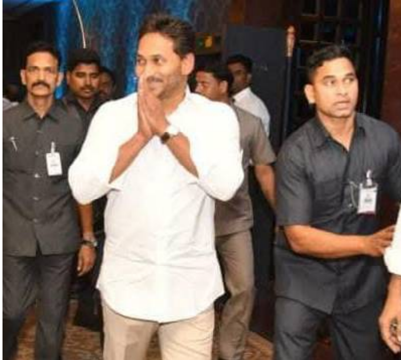
క్రైమ్ కౌంటర్ స్యూస్... ఇవాళ రాత్రి 08:30 గంటలకు బెంగళూరు నుంచి గన్నవరం విమానాశ్రయానికి చేరుకోనున్న వైసీపీ అధినేత, మాజీ సీఎం వైఎస్ జగన్..