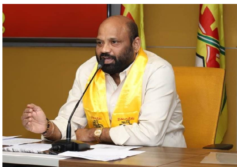
గన్నవరం, ఫిబ్రవరి 11 (క్రైం కౌంటర్ ప్రతినిధి) : గన్నవరం రైతు బజార్ లో అవినీతి జరుగుతుందంటూ వచ్చిన ఆరోపణలపై తక్షణమే విచారణ జరిపి

నివేదిక ఇవ్వాలని ప్రభుత్వ విప్, గన్నవరం ఎమ్మెల్యే యార్లగడ్డ వెంకట్రావు అధికారులను ఆదేశించారు. గన్నవరం రైతు బజార్ లో దుకాణాల కేటాయింపులో అవినీతికి పాల్పడుతున్నట్లు, టమాట, దుంపల విక్రయాలు ఓ వ్యక్తి కనుసన్నల్లో జరుగుతున్నట్లు కొన్ని చాన్సల్లో కథనం ప్రసారమైంది. సదరు ఛానల్ లో వచ్చిన కథనాలకు స్పందించిన ఎమ్మెల్యే యార్లగడ్డ రైతు బజార్ లో జరుగుతున్న కార్యకలాపాలపై ఆరా తీశారు. దుంపల విక్రయాల్లో అక్రమాలు జరుగుతున్నాయా లేదా అని అధికారులు, రైతులను అడిగి తెలుసుకున్నారు. సదరు ఛానల్లో వచ్చిన ఆరోపణలపై పూర్తిస్థాయిలో విచారణ జరిపి నిజాలను నిగ్గు తేల్చాలని, అక్రమాలున్నట్లు తేలితే బాధ్యులపై తగిన చర్యలు తీసుకోవాలని కృష్ణాజిల్లా మార్కెటింగ్ శాఖ సహాయ సంచాలకులను ఆదేశించారు. రైతులు, వినియోగదారుల శ్రేయస్సు కోసం ఏర్పాటు చేసిన రైతు బజార్లలో అక్రమాలు జరగకుండా కట్టుదిట్టమైన చర్యలు తీసుకోవాలని అధికారులను కోరారు. గన్నవరం నియోజకవర్గంలో అవినీతి, అక్రమాలకు చోటు లేదని, అక్రమాలను ఎట్టి పరిస్థితులను సహించేది లేదని యార్లగడ్డ హెచ్చరించారు. గన్నవరం రైతు బజార్ నిర్వహణలో ఏవైనా లోపాలు ఉంటే పూర్తి స్థాయిలో ప్రక్షాళన చేసి పారదర్శకంగా నిర్వహించాలని అధికారులను ఆదేశించారు.