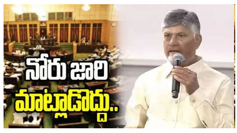
విషయం గుర్తు పెట్టుకోవాలి. ప్రతి రోజు అందరూ అసెంబ్లీ కు రావాల్సింది. గవర్నర్ ప్రసంగం నేను రెండున్నర గంటలు స్టడీ చేశాను. ఇప్పటివరకు మనం చేసిన అభివృద్ధి పనులు గురించి చర్చించాల్సిన అవసరముంది. జాతీయ రహదారులు మన రాష్ట్రంలో లక్ష కోట్ల రూపాయల పనులు జరుగుతున్నాయి. రైల్వేకు సంబంధించి రూ.90 వేల కోట్ల పనులు సాగుతున్నాయి. మీ నియోజకవర్గాలకు సంబంధించిన పనులేమైనా ఉంటే నా దృష్టికి తీసుకురండి. కేంద్ర ప్రభుత్వం.. మన రాష్ట్రం పట్ల చాలా పాజిటివ్ గా ఉంది. విశాఖ స్టీల్ గతేడాది ఇదే ప్రమాణికంలో రూ.450 కోట్లు నష్టంలో ఉంది. కానీ ఈ ఏడాది ఆ నష్టాన్ని పూరించి రూ.50 కోట్ల లాభంలోకి వచ్చింది’ అని అన్నారు.

క్రైం కౌంటర్ స్పాన్ ఫిబ్రవరి 11 : అమరావతి: వైసీపీ అధినేత జగన్ పై సీఎం చంద్రబాబు తీవ్ర ఆగ్రహం వ్యక్తం చేశారు. ఒక్క తిరుపతిలోనే కాదని.. అన్ని దేవాలయాల్లోనూ జగన్ హయాంలో ఇష్టారాజ్యంగా వ్యవహరించారని ధ్వజమెత్తారు. కూటమి ప్రభుత్వం అన్ని మతాలను గౌరవిస్తుందని స్పష్టం చేశారు. అన్ని మతాల సెంటిమెంట్లు ముఖ్యమన్న విషయాన్ని కూటమి నేతలు గుర్తుంచుకోవాలని సూచించారు. వైసీపీ హయాంలో రామ తీర్థంలో రాముడి తల సరికారని ఆగ్రహించారు. అసెంబ్లీకి అందరూ రావాల్సిందే.. ఆంధ్రప్రదేశ్ అసెంబ్లీ బడ్జెట్ సమావేశాలు బుధవారం ఉదయం 10:00 గంటలకు ప్రారంభమైన విషయం తెలిసింది. ఈ నేపథ్యంలో సీఎం చంద్రబాబు అధ్యక్షతన ఎన్డీపీ శాసనసభ పక్ష సమావేశం జరిగింది. ఈ సందర్భంగా ఆయన మాట్లాడుతూ.. ‘అసెంబ్లీ సమావేశాలకు ప్రతి ఒక్కరూ ఉదయం 9:00 గంటలకు అందరూ హాజరు కావాల్సింది. ఉదయం 9:00 గంటల నుంచి 10:00 గంటల వరకే ప్రశ్నోత్తరాలు ఉంటాయి. నేను ప్రతి ఒక్కరినీ గమనిస్తూనే ఉన్నా.. కూటమి పక్షాల అధినేతలుగా ఉన్న మా మధ్య ఎలాంటి విభేదాలూ లేవు. మేమంతా బక్కతగా ఉన్నాం. అభివృద్ధి మా లక్ష్యం. 40 మంది టీడీపీ ఎమ్మెల్యేలను పిలిపించుకుని వారితో మాట్లాడి, వారి పనితీరును సమీక్షిస్తాం. మేం పరిష్కరించాల్సిన సమస్యలు ఏమైనా ఉంటే చెప్పండి’ అని చెప్పారు. ప్రజలకు జవాబుదారీగా ఉండాలి.. టీడీపీ నేతలు ఇష్టం వచ్చినట్లు నోరుజారి మాటాడవద్దు సీఎం చంద్రబాబు దిశా నిర్దేశం చేశారు. ‘మనం 5 కోట్ల మంది ప్రజలకు జవాబుదారీ అనే