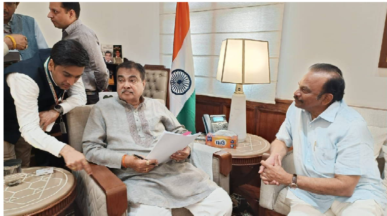
ఆమోదయోగ్యమైన నిర్ణయం తీసుకోవలసినదిగా చెప్పారు. దానికి మంత్రి సానుకూలంగా స్పందించి ప్రత్యేక బృందాన్ని పంపి తగు చర్యలను తీసుకుంటానని తెలియజేశారు.

ఓంగోలు క్రై కౌంటర్ ప్రతినిధి, ఢిల్లీలో కేంద్ర రోడ్డు రవాణా హైవేస్ శాఖ మంత్రి నితిన్ గడ్కరీ ను ఓంగోలు పార్లమెంటు సభ్యులు, మాగుంట శ్రీనివాసులు రెడ్డి కలసి అత్యవసర పరిస్థితులలో విమానాల దిగుటకు ప్రకాశం జిల్లా, శింగరాయకొండ వద్ద ఎమ్మర్షన్స్ లాండింగ్ గతంలో ఏర్పాటుచేయడం జరిగిందని చర్చించారు. ప్రస్తుతం, సదరు ఎమ్మర్షన్స్ లాండింగునకు ఇరువైపుల మరికొంత భూమిని సేకరించుటకు కేంద్ర రోడ్డు రవాణా హైవేస్ శాఖవారు చేసిన ప్రతిపాదనలపై అప్పటి శింగరాయకొండ మండలంలోని మూలగుంటపాడు, కలికివాయి, కనుమల్ల పరిసర గ్రామాల ప్రజలు, స్థానిక నివాసులు స్థలాలు - భూములు కలవారు ప్రతుత భూసేకరణ వలన వారి స్థానిక నివాసాలకు, వ్యవసాయ కార్యకలాపాలకు రోజువారీ పనులకు ఎన్నో ఇబ్బందులు అంతరాయాలు కలుగునని ఈ విషయంపై స్థానికంగా విస్తృత సంప్రదింపులు అంచనా అవసరమన్నదని, పరిశీలించవలసినదిగా కోరారు. మౌలిక సదుపాయాల అభివృద్ధి విమానయాన భద్రత జాతీయ అత్యున్నత ప్రాధాన్యతలతోపాటు, స్థానిక ఇబ్బందులను దృష్టిలో వుంచుకొని వారి విజ్ఞప్తిని పరిశీలించి