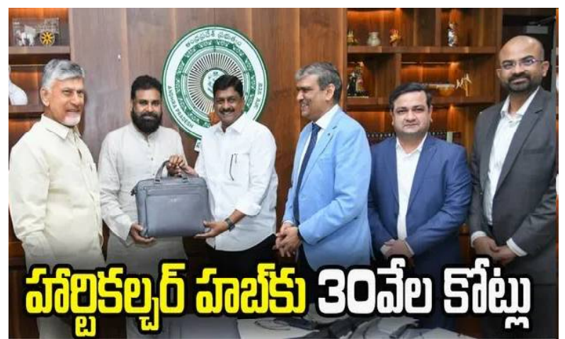
హార్టికల్చర్ హాబ్ కు 30వేల కోట్ల

కూటమి ప్రభుత్వం అమరావతిని గ్రీన్ ఫీల్డ్ సీటీగా తీర్చిదిద్దుతోందని సీఎం తెలిపారు. ఇటీవల క్యాంటం వ్యాపి భవనాలకు శంకుస్థాపన చేసి, అమరావతిని క్యాంటం టెక్నాలజీ హబ్ గా మార్చాలనే లక్ష్యం ప్రకటించామని.. ఇది హైదరాబాద్ ఐటీ రివల్యూషన్ తో పోల్చదగిన మరో విప్లవం అవుతుందని ఆయన అన్నారు.