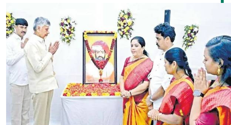
2026-27 వార్షిక బడ్జెట్లో రూ. 9,190 కోట్లు ఎస్టీల కోసం కేటాయించామని సీఎం చంద్రబాబు తెలిపారు.