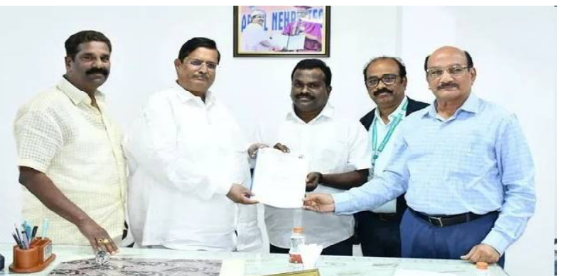
క్రైమ్ కౌంటర్ స్టూన్స్): ఫిబ్రవరి 15 మదనపల్లె అల్లనేరేడుకు మంచి గుర్తింపు ఉంది. వీటికి జీవ ట్యాగు గుర్తింపునకు దరఖాస్తు చేసినట్లు మండలంలోని డిప్యూటీ మిట్లె యూనివర్సిటీ వీసీ యువరాజ్ తెలిపారు. ఆదివారం కళాశాలలో ఆయన మీడియాతో మాట్లాడుతూ మదనపల్లెలోని మిట్లె-ఐపీఎ?ఫిసీ మద్దతుతో శ్రీదేవి జామున్ సాసైటీతో కలిసి జీవ ట్యాగు కోసం చెన్నైలోని సూచికల రిజిస్ట్రీ ఐపీఆర్ కార్యాలయంలో అధికారకంగా దరఖాస్తు చేసినట్లు వివరించారు. దీంతో మదనపల్లె అల్లనేరేడుకు ప్రత్యేక గుర్తింపుతో పాటు అంతర్జాతీయ మార్కెటింగ్కు దోహదపడుతుందని తెలిపారు. ఈ కార్యక్రమంలో వర్సిటీ ప్రో ఛాన్సులర్ ధ్వారకనాథ్, డీసీలు తులసీరామ్ నాయుడు, శివయ్య, రవీంద్ర పాల్గొన్నారు.