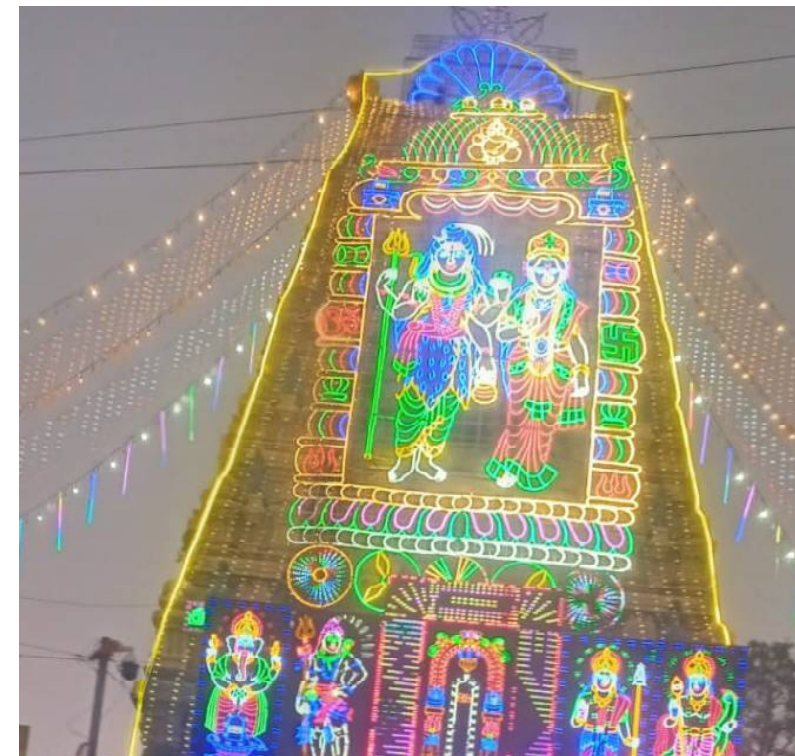
క్రైమ్ కౌంటర్ కోటేశ్వరరావు అమరావతి స్టూన్స్ : అమరేశ్వరుడి పవిత్ర పుణ్యక్షేత్రం అమరావతి గ్రామంలో శివరాత్రి ఉత్సవాలు అంగరంగ వైభవంగా మొదలైనాయి . రాజోయే మూడు రోజులు అమరావతి గ్రామంలో ఘనంగా నిర్వహిస్తారు . రాష్ట్ర నలుమూలల నుండి భక్తులు పెద్ద ఎత్తున పాల్గొని స్వామివారి ఆశీర్వాదాలు అందుకుంటున్నారు . ఆలయాన్ని విద్యుత్ కాంతులతో భారీ లైటింగ్ తో అలంకరించారు భక్తులు ఆదివారం నుండి పెద్ద ఎత్తున పాల్గొంటున్నారు.