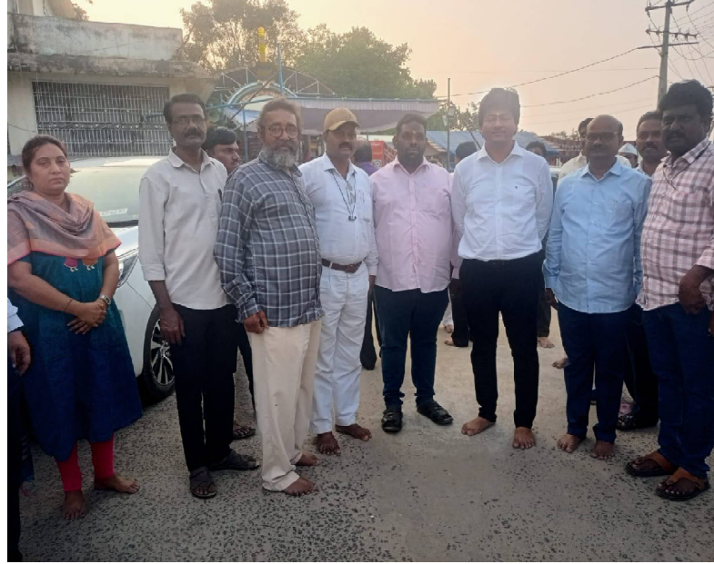
అలయ ఈవో రేఖా మాట్లాడుతూ భక్తులకు దర్శన ఏర్పాట్లు మరియు అధికారులకు దర్శన ఏర్పాట్లు ప్రత్యేకంగా ఏర్పాటు చేశామని ప్రజలకు ఎవరికీ ఇబ్బంది కలుగకుండా చూస్తున్నామన్నారు. స్వామి వారి దీవెనలు ప్రజలందరి మీద ఉండాలని కృష్ణ తేజ, జ్యోతిబసు కోరుకున్నారు.