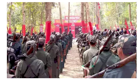
మార్చి 15 క్రైమ్ కౌంటర్ న్యూస్: మొయినాబాద్ డ్రగ్స్ కేసులో ఆరోపణలు