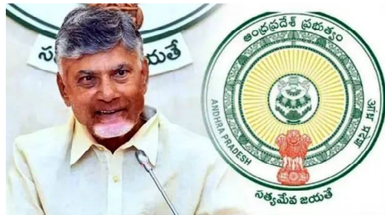
ంది. ఇది శాఖలో పనితీరును మరింత సమర్థవంతంగా మార్చే దిశగా పరిగణించవచ్చు.

క్రైమ్ కౌంటర్ న్యూస్, అమరావతి, ఫిబ్రవరి 16: ఆంధ్రప్రదేశ్ రాష్ట్ర ప్రభుత్వం ఉద్యోగాల పరిమితులను సమర్థవంతంగా నిర్వహించడానికి తీసుకుంటున్న మార్పుల్లో భాగంగా మరో కీలక నిర్ణయం తీసుకుంది. రెవెన్యూ శాఖలోని ఎమ్మార్వో కార్యాలయాల్లో పని చేసే జూనియర్ అసిస్టెంట్ కమి కంప్యూటర్ అసిస్టెంట్ పోస్టు పేరును మారుస్తూ, జూనియర్ ఆఫీస్ అసిస్టెంట్ గా ఉత్తర్యులు విడుదల చేసింది. ఉత్తర్యుల ప్రకారం, ఇప్పటికే ఈ పోస్టులో పనిచేస్తున్న ఉద్యోగులు ఇక నుంచి జూనియర్ ఆఫీస్ అసిస్టెంట్ గా పరిగణిస్తున్నట్లు స్పష్టం చేసింది. ఈ మార్పు కారణంగా ఉద్యోగ వివరణలు, జాబ్ ప్రొఫైల్, సమర్థతా ప్రమాణాలు స్పష్టతతో గుర్తిస్తున్నట్లు తెలిపింది. ముఖ్యంగా జూనియర్ అసిస్టెంట్లు, కంప్యూటర్ అసిస్టెంట్ గా నిర్వహిస్తున్న విధులు ఇప్పుడు జూనియర్ ఆఫీస్ అసిస్టెంట్ గా మారాయి. రెవెన్యూ శాఖలో వర్క్ లోడును సరళీకరణ చేయడం, పోస్టుల మధ్య స్పష్టత, ఉద్యోగుల బాధ్యతలను సులభంగా గుర్తించడం ఈ మార్పు లక్ష్యంగా ఉ