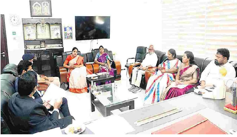
ఆదివాసీలకు శతశాతం రిజర్వేషన్ కల్పనకు కట్టుబడి ఉన్నాం అరకు కాఫీ తరహాలో లంబసింగిలో కుంకుమపువ్వు సాగు ముఖ్యమంత్రి చంద్రబాబునాయుడు

అరకు పార్లమెంట్ నియోజకవర్గ ఇన్చార్జులు, కలెక్టర్, ఎస్పీతో భేటీ