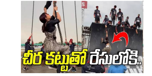
చీర కట్టుతో రేసులోకి..

చెప్పారు. అహింసా మార్గంలో ఆయన ఆంధ్ర రాష్ట్రాన్ని సాధించారని గుర్తు చేశారు. పొట్టి శ్రీరాములు త్యాగం ఈ తరం వాళ్లు తెలుసుకోవాలన్నారు. స్ఫూర్తికి మారు పేరు ఆర్యవైశ్య సంఘమని పేర్కొన్నారు. మహాత్మా గాంధీ నాయకత్వంలో పొట్టి శ్రీరాములు పనిచేశారని తెలిపారు. అలాగే అనేక సామాజిక ఉద్యమాల్లో ఆయన భాగస్వాములయ్యారని పేర్కొన్నారు. పొట్టి శ్రీరాములు ఆత్మార్పణ చేసి రాష్ట్రాన్ని సాధించి పెట్టారని చెప్పారు. ఇక రాజధాని అమరావతి నిర్మాణంలో ఎంతోమంది రైతుల త్యాగం ఉందన్నారు. రాజధాని నిర్మాణానికి 29 వేల మంది రైతులు.. 33 వేల ఎకరాల భూమి ఇచ్చారని గుర్తు చేశారు. ప్రపంచంలో ఎక్కడా లేని విధంగా భారీ ల్యాండ్ పూలింగ్ కు సహకరించారని వివరించారు. రాజధాని లేని రాష్ట్రంలో వైసీపీ.. మూడు ముక్కలాట ఆడిందంటూ ఆగ్రహం వ్యక్తం చేశారు. అమరావతిని గత పాలకులు సృష్టించిన అని అవహేళన చేశారని తెలిపారు. పొట్టి శ్రీరాములు 58 రోజుల ఢిల్లీ గుర్తుగా 58 అడుగుల