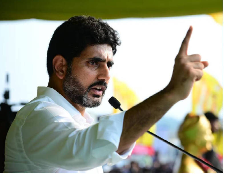
క్రైమ్ కౌంటర్ సూపర్, అమరావతి, ఫిబ్రవరి 19 యువతకు పెద్దఎత్తున ఉ

ద్యోగాల కల్పనే తమ లక్ష్యమని ఆంధ్రప్రదేశ్ విద్య, ఐటీ శాఖల మంత్రి నారా లోకేశ్ అన్నారు. అందుకు అనుగుణంగా అధికారులు రూల్స్ మ్యాప్ సిద్ధం చేయాలని దిశానిర్దేశం చేశారు. కోవింగ్ సెంటర్ల నిర్వహణపై సుప్రీంకోర్టు మార్గదర్శకాల అమలుపై రివ్యూ చేశారు. విద్యాశాఖ ఉన్నతాధికారులతో మంత్రి లోకేశ్ ఇవాళ(గురువారం) సచివాలయంలో సమీక్ష సమావేశం నిర్వహించారు. ఈ సమావేశంలో పలు కీలక అంశాలపై అధికారులకు మంత్రి లోకేశ్ మార్గనిర్దేశం చేశారు. జాబ్ క్యాలెండర్ తో పాటు యూనివర్సిటీల్లో అధ్యాపక పోస్టుల భర్తీకి కసరత్తు చేస్తున్నామని మంత్రి లోకేశ్ పేర్కొన్నారు. మంత్రి నారా లోకేశ్ ఇవాళ (గురువారం) రాత్రి ఉండవల్లి నివాసంలో.. ఒంగోలు, బాపట్ల కూటమి ప్రజాప్రతినిధులు, వారి కుటుంబసభ్యులకు ఆత్మీయ విందు ఇచ్చారు. ఈ విందు భేటీ వేడుకలా జరిగింది. నిత్యం రాజకీయాలు, ప్రభుత్వ కార్యక్రమాలు, నియోజకవర్గ సమస్యలతో క్షణం తీరికలేకుండా గడిపే ప్రజాప్రతినిధులకు.. మంత్రి నారా లోకేశ్ ఆత్మీయ విందు ఇచ్చారు. మూడు గంటల పాటు రాజకీయాలతో సంబంధంలేని సరికొత్త ఆనంద ప్రపంచంలో ఉంచారు. నో పాలిటిక్స్.. నో అసెంబ్లీ డిస్కషన్స్.. సరదా సంభాషణలు.. ఆట పట్టించుకోవడం.. ఇలా ఫుల్ జోష్ తో ఆత్మీయ విందు సాగింది.