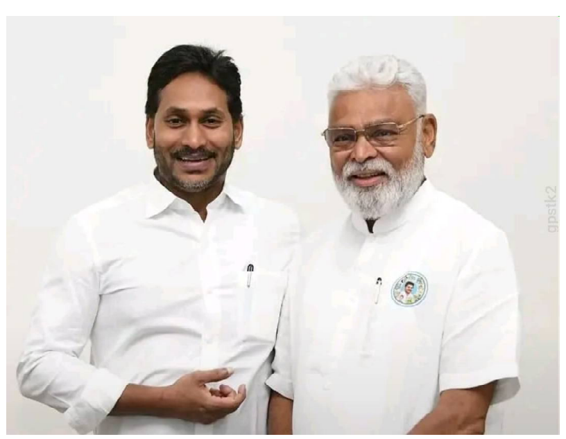
క్రైమ్ కౌంటర్ స్యూస్.. వైసీపీ చీఫ్ జగన్ మోహన్ రెడ్డితో ఆ పార్టీ సీనియర్ నేత అంబటి రాంబాబు భేటీ అయ్యారు. రెండు రోజుల క్రితం ఆయన జైలు నుంచి విడుదలైన విషయం తెలిసింది. ఈ క్రమంలోనే అధినేతను కలిసే పలు అంశాలపై చర్చించినట్లు సమాచారం. ప్రజా పోరాటం ఆపాదన అంటికి జగన్ సూచించారు. కూటమి ప్రభుత్వం తప్పుడు కేసులు పెట్టిందని, వాటిని న్యాయపరంగా ఎదుర్కొందామని చెప్పారు. కొందరు పోలీసుల తీరును కూడా జగన్ తప్పుబట్టారు.