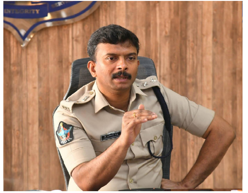
తెలియజేస్తున్నారు. ట్రాక్టర్లు, ఆటోలు, గూడ్స్ వాహనాలు నిబంధనలకు విరుద్ధంగా నడిపినట్లయితే సంబంధిత వ్యక్తులపై చట్టపరమైన చర్యలు తీసుకుంటామని జిల్లా ఎస్పీ, హెచ్చరించారు.

ప్రమాదాల నివారణ దిశగా పోలీసు అధికారులు అవగాహన సమావేశాలు నిర్వహిస్తూ, నిబంధనలు పాటించకపోవడం వల్ల కలిగే నష్టాలను వివరంగా