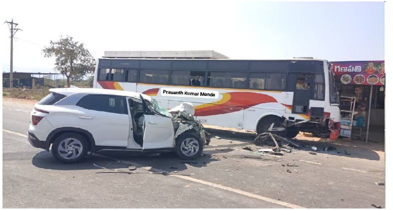
క్రైమ్ కౌంటర్ స్యూస్...మార్కాపురం జిల్లా...దోర్నాల - శ్రీశైలం రహదారిలోని మల్లికార్జున నగర్ వద్ద ఆగి ఉన్న ఆర్టీసీ బస్సును ఢీకొన్న కారు. ఇద్దరికీ గాయాలు. ధ్వంసమైన కారు ముందుభాగం, అలాగే దెబ్బతిన్న బస్సు ముందు భాగం. దర్యాప్తు చేపట్టిన పోలీసులు....!!