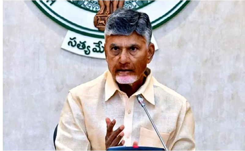
క్రైమ్ కౌంటర్ స్యూస్, అమరావతి, ఫిబ్రవరి 21 సీఆర్‌డీఏ ప్రాజెక్టుల కోసం

ల్యాండ్ పూలింగ్ విధానంలో ఆంధ్రప్రదేశ్ ప్రభుత్వం కీలక నిర్ణయం తీసుకుంది. ఇకపై ప్రాజెక్టులను నిర్వహించే ల్యాండ్ పూలింగ్ చర్యలు ప్రతీ జిల్లా కలెక్టర్ ఆధ్వర్యంలో జరుపుకోవాలని నిర్ణయించింది. సమాచారం ప్రకారం, భవిష్యత్తులో న్యాయపరమైన సమస్యలు, వివిధ రకాల చిక్కులు తలెత్తకుండా ఈ మార్పు చేసినట్లు సమాచారం. ఇప్పటికే ల్యాండ్ పూలింగ్ ద్వారా తీసుకున్న భూములకు సంబంధించిన వివాదాలను పరిష్కరించడానికి భూ యజమానులు అనేక దఫాలు కలెక్టర్ కార్యాలయానికి వెళ్తుంటారు. ఈ వ్యవహారాలను సమగ్రంగా, క్లిష్టతరం లేకుండా నిర్వహించేందుకు కలెక్టర్ బాధ్యత తప్పనిసరిని సీఆర్‌డీఏ, ప్రభుత్వం భావిస్తోంది. ప్రస్తుత విధానం ప్రకారం, భూ యజమానులు, సీఆర్‌డీఏ అధికారుల మధ్య నేరుగా జరుగుతున్న లావాదేవీలు, భూ స్వాధీనం, పరిమితులు, పరిష్కారాలు కలెక్టర్ అధికారుల పర్యవేక్షణలో జరుగుతాయి. దీంతో ల్యాండ్ పూలింగ్ ప్రక్రియలో గందరగోళాలు, ప్రోసీడింగ్స్ సమస్యలు, న్యాయపరమైన సమస్యలు తక్కువగా వచ్చే అవకాశముందని అధికారులు అభిప్రాయపడుతున్నారు. ప్రభుత్వ వర్గాలు పేర్కొన్న విధంగా, ఈ మార్పు ద్వారా భవిష్యత్తులో వివాదాలను తక్కువ సమయంలో పరిష్కరించడానికి, ల్యాండ్ పూలింగ్ ప్రక్రియను సులభతరం చేయడానికి ఇది కీలకంగా మారనుందని తెలిపారు. ఇది సీఆర్‌డీఏ ప్రాజెక్టుల భవిష్యత్తు విధానాలను మరింత పారదర్శకంగా, సమర్థవంతంగా, భూ యజమానులకు న్యాయ పరమైన రక్షణ కల్పించే ప్రయత్నంగా కూడా చూడవచ్చని ప్రభుత్వ అధికారులు భావిస్తున్నారు.