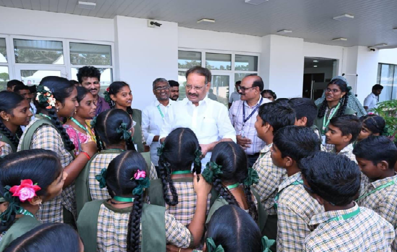
క్రైం కౌంటర్ కోటేశ్వరరావు వేమురు నియోజకవర్గం : విద్యార్థులకు శాసన సభ వాణి కార్యకలాపాలు పై అవగాహన కార్యక్రమం లో భాగంగా సోమవారం వేమురు నియోజకవర్గం భట్టిప్రోలు మండలం ఐలవరం గ్రామ జిల్లా పరిషత్