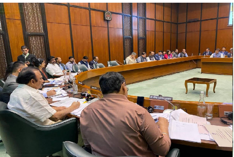
ఓంగోలు క్రైమ్ కౌంటర్ ప్రతినిధి, ఢిల్లీలో పార్లమెంట్ హాల్ లో గృహ, పట్టణవ్యవహారాల కమిటీ చైర్మన్, ఓంగోలు పార్లమెంట్ సభ్యులు మాగుంట శ్రీనివాసులు రెడ్డి ఆధ్వర్యంలో సమీక్ష సమావేశం సోమవారం జరిగింది. సమావేశంలో కమిటీ సభ్యులు, అధికార ప్రతినిధులు పాల్గొన్నారు.