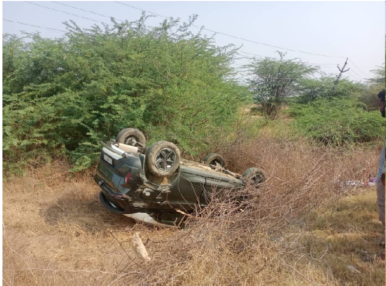
క్రైమ్ కౌంటర్ న్యూస్...మార్కాపురం జిల్లా ....ముళ్లపాడు గ్రామంలోని నా పెట్రోల్ బంక్ వద్ద కారు ప్రమాదం పూర్తి వివరాలు తెలియాల్సి ఉంది