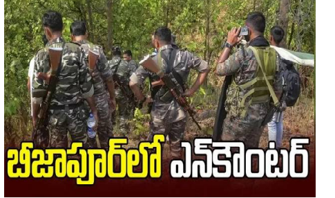
బీజాపూర్ లో ఎన్ కౌంటర్