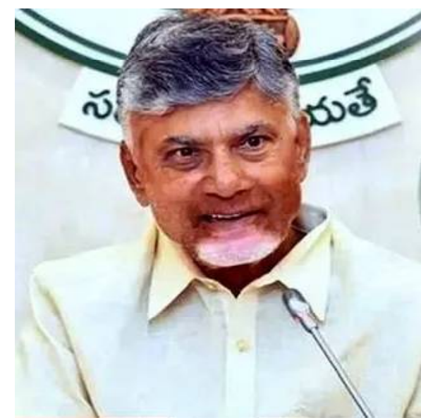
అమరావతి, ఫిబ్రవరి 26 క్రైమ్ కౌంటర్ న్యూస్: మున్సి పాలిటీల్లో డయేరియా ప్రబలకుండా ముందస్తు జాగ్రత్త కోసం ఏపీ ప్రభుత్వం కీలక ఆదేశాలు జారీ చేసింది.