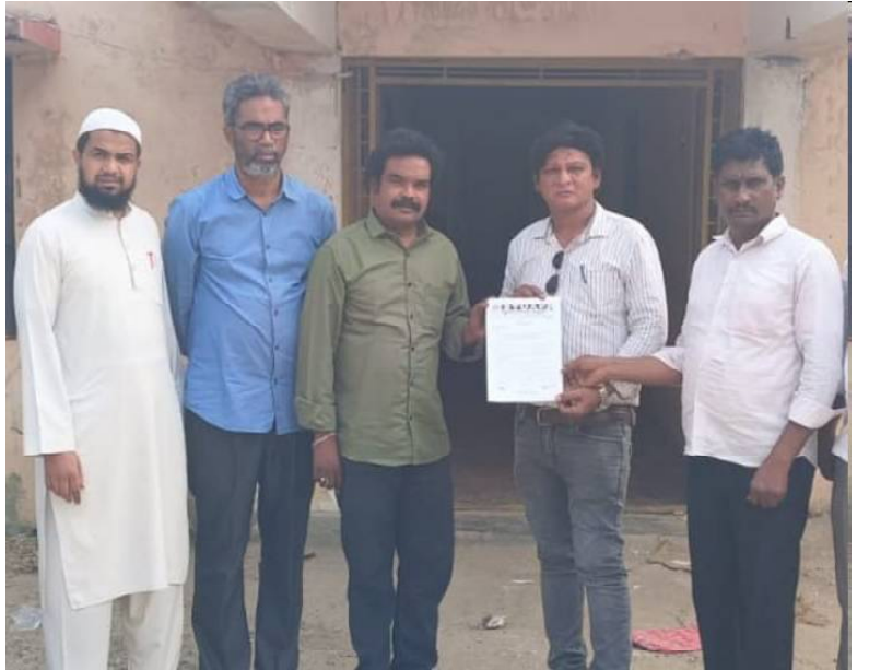
క్రైంకౌంటర్ కోటేశ్వరరావు పెదకూరపాడు స్టూప్ : ఉద్యోగ, ఉపాధ్యాయ, పెన్షనర్లకు మేనిఫెస్టోలో ఇచ్చిన హామీలు అమలుకు సంబంధించి ఎస్ టి యు చేస్తున్న దశల వారి ఉద్యమంలో భాగంగా పెదకూరపాడు మండల రెవెన్యూ