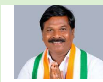
ఈ నిర్ణయం తీసుకున్నట్లుగా వెల్లడించారు. త్వరలోనే అచ్చంపేట మున్సిపాలిటీ లోని ప్రతి కాలనీలో రేషన్ షాప్ సేవలు ప్రజల చెంతకి అందుబాటులోకి వస్తాయని ఆయన పేర్కొన్నారు.

నాగర్ కర్నూల్ జిల్లా అచ్చంపేట నియోజకవర్గం స్థానిక ఎమ్మెల్యే డాక్టర్ చిక్కుడు వంశీకృష్ణ ప్రతిష్టాత్మకమైన నిర్ణయం తీసుకున్నారు. అచ్చంపేట మున్సిపాలిటీ పరిధిలోని ప్రతి కాలనీలో రేషన్ దుకాణం ఉండేలా చర్యలు తీసుకుంటున్నట్లు ఆయన తెలిపారు. ఈ సందర్భంగా ఆయన మాట్లాడుతూ ప్రస్తుతం రేషన్ దుకాణాలు అందుబాటులో లేక వినియోగదారులు పడుతున్నటువంటి ఇబ్బందులను గమనించి ఈ నిర్ణయం తీసుకున్నట్లుగా వెల్లడించారు. త్వరలోనే అచ్చంపేట మున్సిపాలిటీ లోని ప్రతి కాలనీలో రేషన్ షాప్ సేవలు ప్రజల చెంతకి అందుబాటులోకి వస్తాయని ఆయన పేర్కొన్నారు. స్థానిక ఎమ్మెల్యే తీసుకున్న ప్రతిష్టాత్మక నిర్ణయానికి అచ్చంపేట పట్టణ ప్రజలు అభినందనలు తెలిపారు. స్థానికులంతా ఆనందం వ్యక్తం చేశారు.