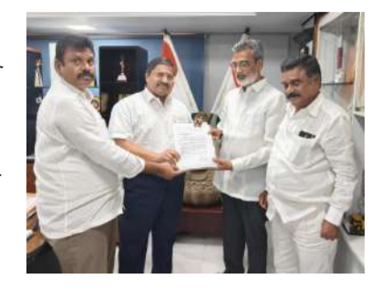
భద్రతకు కూడా ముప్పు కలిగించవచ్చు. కావున, జూలై నవంబర్ 2025 బోర్డులో 'ఫిట్' అని ప్రకటించబడిన వారికి పునఃవైద్య పరీక్షలు రీ- మెడికల్ ఎడమినేషన్) నిర్వహించాలి. ఈ విషయాన్ని గతంలో పలుమార్లు యాజమాన్యం దృష్టికి తీసుకెళ్లినప్పటికీ, ఇప్పటివరకు ఎటువంటి పురోగతి లేదు. సీఎం బి నిర్వహణ కాలపరిమితి: గతంలో ఉన్న పద్ధతి ప్రకారం, కార్పొరేట్ మెడికల్ బోర్డును ప్రతి నెలా

బోర్డు నిర్వహించబడింది. అనంతరం, సిక్ రోల్స్లో (సిక్ రోల్స్) ఉన్న ఉద్యోగుల కోసం నవంబర్ 2025లో మరొక మెడికల్ బోర్డును నిర్వహించారు. అయితే, అప్పటి నుండి ఇప్పటి వరకు ఎటువంటి మెడికల్ బోర్డు నిర్వహించబడలేదు. ఈ నేపథ్యంలో, ఈ క్రింది అంశాలను మీ పరిశీలన కోసం సమర్పిస్తున్నాము: సి ఎం బి నిర్ణయాల సమీక్ష: కార్పొరేట్ మెడికల్ బోర్డు మూల్యాంకన ప్రక్రియను పునఃసమీక్షించాల్సిన అవసరం ఉంది. తీవ్రమైన గుండె జబ్బులు, సరాల వ్యాధులు, కిడ్నీ సమస్యలు శారీరక వైకల్యంతో బాధపడుతున్న ఉద్యోగులను కూడా పలు సందర్భాల్లో విధులకు అర్హులుగా (ఫిట్) ప్రకటించడం గమనించబడింది. ఇటువంటి రివర్ట్ చేయబడిన ఉద్యోగుల కోసం ఉద్యోగులను విధుల్లో చేర్చుకోవడం వారి భద్రతకే కాకుండా ఇతరుల