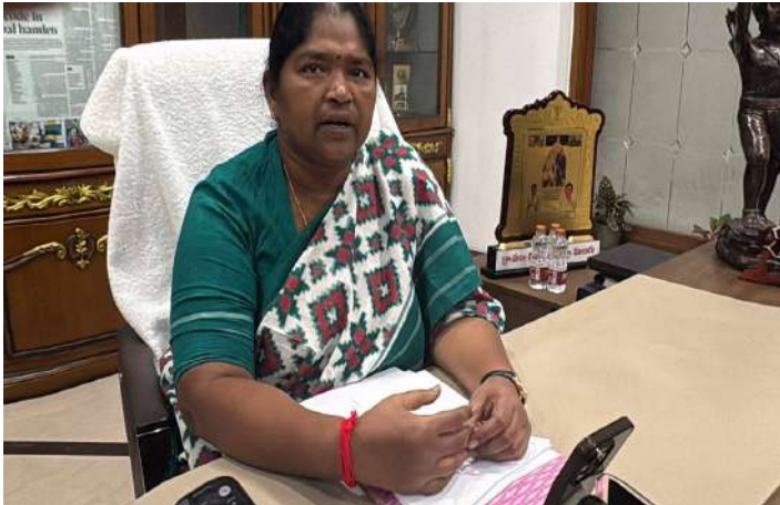
ఢిల్లీలో జరిగిన షీ స్పార్స్ 2026 ' కార్యక్రమంలో సీతక్క

దోపిడీకి వ్యతిరేకంగా నక్సలైట్ ఉద్యమం ప్రజాసేవకోసం రాజకీయాల్లోకి రాక భారత రాజ్యాంగం వల్లే ఇది సాధ్యం