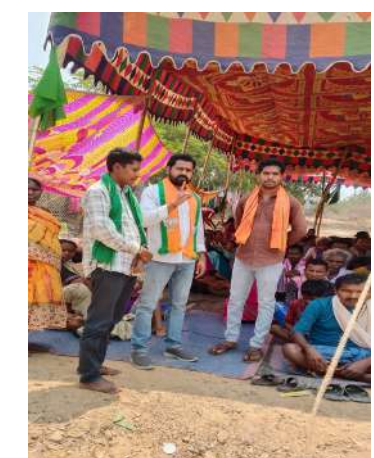
ఆదివాసీలు చంటి పిల్లలతో ఊరంతా

భద్రద్రి కొత్తగూడెం జిల్లా అశ్వాపుషేట మండలం రామన్నగూడెం గ్రామస్థులు కొత్తగూడెం కలెక్టరేట్ దగ్గర భూ సమస్య పై నిరాహార దీక్ష చేస్తున్నారు వారికి మద్దతు తెలిపిన బీజేపీ నాయకులు, వారు మాట్లాడుతున్న రామన్నగూడెం గ్రామములో ఉన్న భూ సమస్యకి పరిష్కారం చూపాలని గత 6 రోజులు గా కలెక్టర్ కార్యాలయం దగ్గర