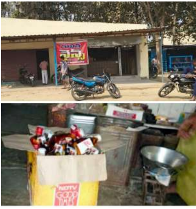
అక్రమ మద్యం విక్రయాలను అరికట్టాలని, బెల్ట్ షాపులపై కఠిన చర్యలు తీసుకోవాలని ప్రజలు డిమాండ్ చేస్తున్నారు.

కార్యాలయం వద్ద, ప్రధాన రహదారి ప్రాంతాల్లో, అలాగే ప్రైవేటు మరియు ప్రభుత్వ పాఠశాలల సమీపంలో కూడా బెల్ట్ షాపులు కొనసాగుతున్నాయి. మేజర్ గ్రామపంచాయతీ సారపాకల్ గ్యాస్ డీలర్ షిప్ వద్ద, ప్రభుత్వ పాఠశాల సమీపంలో, బడిసీ ప్రధాన గేటు దగ్గర, లారీ ఆఫీసుల వద్ద, వినాయకుడి ఆలయం పరిసరాల్లో, వీధి వీధిలో కొత్తగా బెల్ట్ షాపులు వెలుస్తున్నాయని ప్రజలు చెబుతున్నారు. ఈ పరిస్థితిపై “అడిగేది ఎవరూ.. ఆపేది ఎవరూ..” అనే ప్రశ్నలు వినిపిస్తున్నాయి. ప్రజా ప్రదేశాలు, విద్యార్థులు, ఆలయాల సమీపంలో అక్రమ మద్యం విక్రయాలు కొనసాగడం ఆందోళనకరమని స్థానికులు అంటున్నారు. ఇప్పటికైనా సంబంధిత అధికారులు స్పందించి