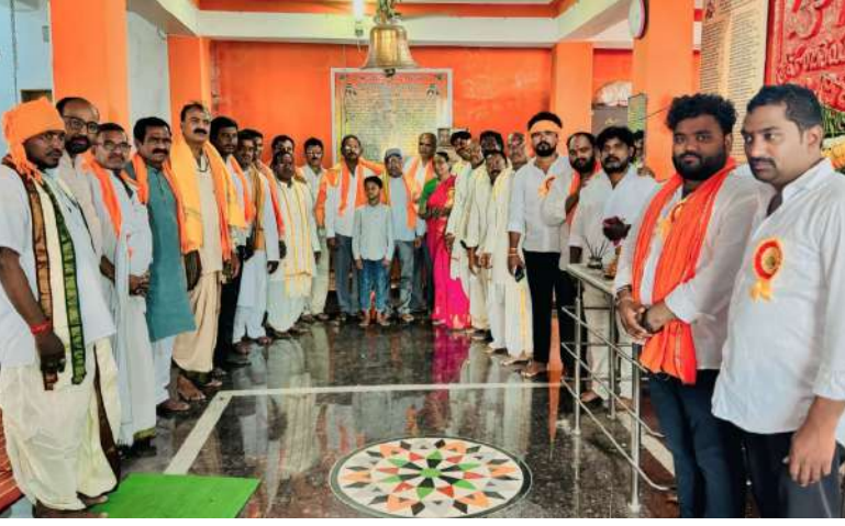
ఆలయ కమిటీ సభ్యులు, కాలనీవాసుల నడుమ జరుగుతున్న సీతారాముల కళ్యాణం