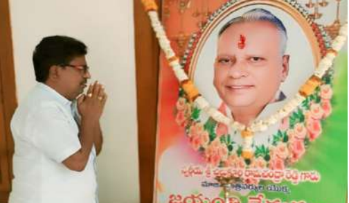
రవి కాంగ్రెస్ నాయకులు, కార్యకర్తలు పెద్ద సంఖ్యలో పాల్గొన్నారు.