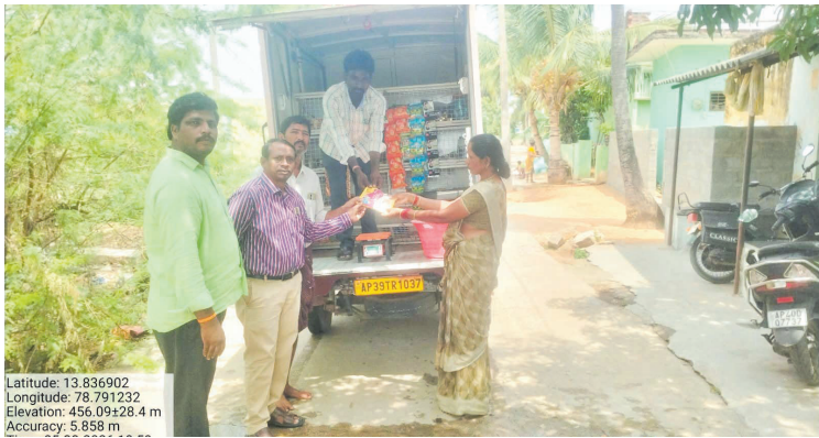
Latitude: 13.836902 Longitude: 78.791232 Elevation: 456.09±28.4 m Accuracy: 5.658 m

స్వచ్ఛ రథం షెడ్యూల్లో భాగంగా శనివారం బాలయ్యగారి పల్లి గ్రామ పంచాయతీలో స్వచ్ఛ రథం సేవలు ప్రజలకు అందించ బడుతున్నాయి. ఈ సందర్భంగా కలకడ ఎంపీడిఓ ఆకస్మికంగా గ్రామంలో ఫీల్డ్ పర్యటన నిర్వహించి స్వచ్ఛ రథం పనితీరును పరిశీలించారు. స్వచ్ఛ రథం ద్వారా గ్రామంలో చెత్త సేకరణ, వ్యర్థాల నిర్వహణ, పరిశుభ్రత కార్యక్రమాలు ఎలా అమలువు తున్నాయో ప్రత్యక్షంగా తెలుసుకున్నారు. అనంతరం గ్రామ ప్రజలతో మాట్లాడి స్వచ్ఛ రథం సేవలపై వారి అభిప్రాయాలను అడిగి తెలుసుకున్నారు. ఈ సందర్భంగా ప్రజలకు పొడి చెత్తను వేరుగా సేకరించి స్వచ్ఛ రథానికి అందజేసే ప్రభుత్వం అందించే ప్రోత్సాహక పథకాల ద్వారా అవసరమైన సరుకులు పొందే అవకాశం ఉంటుందని అవగాహన