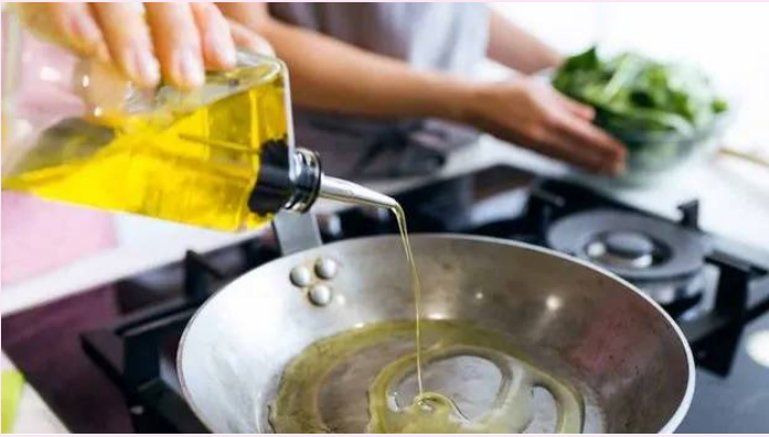
హైదరాబాద్, మార్చి 31 (తెలుగురేఖ):

హైదరాబాద్లో కల్తీ వంట నూనె దందా తీవ్ర కలకలం రేపిస్తోంది. హైటెక్ సిటీలో కల్తీ వంట నూనె విక్రయాలు జోరుగా సాగుతున్నాయన్న సమాచారం వెలుగులోకి వచ్చింది. హోటళ్లలో వాడెసిన వంటనూనెను కిలోకు రూ. 20కు సేకరిస్తున్న ముఠా... దాన్ని వీధి వ్యాపారులకు రూ. 70కు అమ్ముతున్నట్లు బయటపడింది. లాభాల కోసం ప్రజల ఆరోగ్యంతో చెలగాటం ఆడుతున్న ముఠా గుట్టు బయటపడింది. నాచారం ప్రాంతంలో శుద్ధి పేరుతో మల్టీ ప్యాకెట్లలో నింపితూ దందా చేస్తున్నట్లు గుర్తించారు. సమాచారం అందిన వెంటనే రంగంలోకి దిగిన మాదాపూర్ పోలీసులు... కల్తీ నూనె సేకరిస్తున్న వ్యక్తులను అరెస్ట్ చేశారు. మాదాపూర్, గచ్చిబౌలి ప్రాంతాల్లోని రెస్టారెంట్ల నుంచి వాడెసిన నూనెను సేకరించి... కర్ణాటక రిజిస్ట్రేషన్ ఆఫీస్ వందల లీటర్లు తరలిస్తున్న ముఠాను పోలీసులు అదుపులోకి తీసుకున్నారు. సుమారు 20 డబ్బాల్లో కల్తీ నూనెను గుర్తించారు. నిందితులు సరైన పత్రాలు చూపించలేక తప్పించుకునే ప్రయత్నం చేశారు. చివరకు వీధి వ్యాపారులకు కల్తీ వంట నూనెను అమ్ముతున్నట్లు పోలీసులు ఎదుట ఒప్పుకున్నారు.