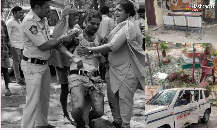
విజయవాడ, మార్చి 31 (తెలుగురేఖ):