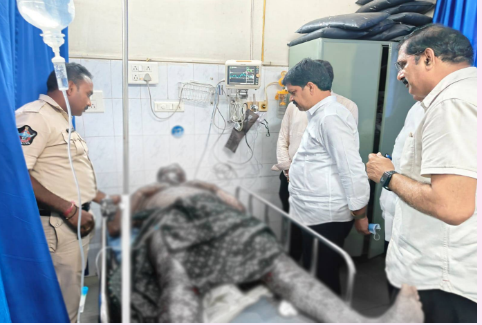
అమరావతి, మార్చి 31 (తెలుగురేఖ):

- మెరుగైన వైద్యం అందుతోందని మంత్రి కొల్లు వెల్లడి