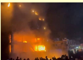
హైదరాబాద్, మార్చి 13 (తెలుగు రేఖ):

నగరంలోని చందానగర్ ప్రాంతంలో ఉన్న ఒక ఫర్టీచర్ దుకాణంలో గురువారం అగ్రరాత్రి తర్వాత భారీ అగ్నిప్రమాదం సంభవించింది. ఈ ప్రమాదంలో దుకాణంలోని ఐదు అంతస్తుల్లో నిల్వ చేసిన ఫర్టీచర్ మొత్తం తగలబడింది. స్థానికులు ఇచ్చిన సమాచారంతో అగ్నిమాపక సిబ్బంది వెంటనే సంఘటనా స్థలానికి చేరుకుంది. 7 ఫైర్ ఇంజన్లు, 11 వాటర్ ట్యాంకర్లతో మంటలను అదుపులోకి తెచ్చారు. దుకాణం ఐదు అంతస్తుల భవనంలో ఉండటం, తోప సోఫాలు, డెడ్ లైట్లు తదితరాలు ఉండడం వల్ల మంటలు వేగంగా వ్యాపించినట్లు తెలుస్తోంది. అగ్నిప్రమాదానికి కారణం ఏంటనేది తెలియాల్సి ఉంది. షాద్ నర్సూట్, గ్యాస్ లీకేజీ లేదా ఇతర కారణాలు ఉండవచ్చని భావిస్తున్నారు. పోలీసులు, అగ్నిమాపక అధికారులు సంయుక్తంగా ఘటన స్థలంలో దర్యాప్తు చేస్తున్నారు. ఈ ప్రమాదం కారణంగా చందానగర్ ప్రాంతంలో కొంత వరకూ సేవలకు అంతరాయం కలిగినట్లు తెలుస్తోంది. ప్రమాదానికి సంబంధించిన పూర్తి వివరాలు తెలియాల్సి ఉంది.