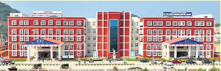
శ్రీకాకుళం, మార్చి 13 (తెలుగు రేఖ):

శ్రీకాకుళం జిల్లా ఉద్ధానం ప్రాంత ప్రజల దశాబ్దాల కల నెరవేరబోతోంది. కిడ్నీ వ్యాధులతో బాధపడుతున్న రోగులకు అందగా ఆంధ్రప్రదేశ్ ప్రభుత్వం పలసంలో చారిత్రాత్మక అడుగు వేసింది. పలసం కిడ్నీ రీసెర్చ్ సెంటర్లో రాష్ట్రంలోనే అత్యంత ప్రతిష్టాత్మకంగా, తొలి కిడ్నీ మార్పిడి శస్త్రచికిత్సను అన్ని ఏర్పాట్లు పూర్తిచేయాలి. అత్యధునిక సాంకేతిక పరిజ్ఞానంతో, అంతర్జాతీయ ప్రమాణాలకు అనుగుణంగా ఈ ఆపరేషన్ నిర్వహించనున్నారు. దేశంలోని ప్రముఖ కిడ్నీ మార్పిడి నిపుణులు ప్రత్యేకంగా పలసంకు విచ్చేసి స్థానిక వైద్యులతో కలిసి ఈ కిడ్నీ మార్పిడిని విజయవంతంగా పూర్తి చేయనున్నారు. కిడ్నీ వ్యాధిగ్రస్తులకు మెరుగైన వైద్యం అందించడమే ప్రధాన లక్ష్యంగా ఆంధ్రప్రదేశ్ ప్రభుత్వం కృషి చేస్తోంది. పలసం సెంటర్ అభివృద్ధికి రూ. 12 కోట్ల నిధులు మంజూరు చేసి, ఆపరేషన్ థియేటర్ అధునికీకరణ, డయాలసిస్ యూనిట్లు, పోస్ట్ - ఆపరేషన్ కేర్ సెంటర్లను బలోపేతం చేసింది. పేద రోగులకు ఎక్కువ ఖర్చుతో ప్రైవేట్ ఆస్పత్రుల్లో పాండి కిడ్నీ మార్పిడి చికిత్సను పలసం కేంద్రంలోనే ప్రభుత్వం బాధ్యతగా నిర్వహిస్తోంది. గతంలో కిడ్నీ సమస్యల చికిత్స కోసం ఉద్ధానం వాసులు విశాఖపట్నం, హైదరాబాద్ వంటి నగరాలకు వెళ్లివారు. ఇప్పుడు పలసంలోనే ఈ సదుపాయం రావడం వల్ల ప్రయాణ భారం తగ్గుతోందటంతో పాటు అత్యవసర సందర్భాల్లో ప్రాణాలు కాపాడే అవకాశాలు మెరుగుపడతాయి. కిడ్నీ రీసెర్చ్ సెంటర్ ద్వారా నిరంతరం స్ట్రీనింగ్ పరీక్షలు, మందుల పంపిణీ జరుగుతుంది. పేద రోగులకు ప్రైవేట్ ఆస్పత్రులలో లక్షల రూపాయలు ఖర్చయ్యే చికిత్స ఇక్కడ ఉచితంగా లేదా రాయితీపై అందుబాటులో ప్రభుత్వం తీసుకువచ్చింది.