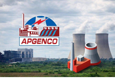
అమరావతి, మార్చి 13 (తెలుగు రేఖ):

ఎపీ పవర్ జెనరేషన్ కార్పొరేషన్ విజయవాడ ఆంధ్రప్రదేశ్ ముఖ్యమంత్రి నారా చంద్రబాబు నాయుడు అభినందించారు. ఎపీ జెన్కో ఒకే రోజు 6160 మెగావాట్ల ధర్మల్ విద్యుత్ ఉత్పత్తి సాధించి సరికొత్త పరిత్ర సృష్టించినది విజయవాడ. ఈ నెల 11వ తేదీన, 6160 మెగావాట్ల ఉత్పత్తితో 93.19 శాతం సామర్థ్యాన్ని సాధించడం గొప్ప విషయమని తెలిపారు. ఈ రికార్డు ఒక్కరోజే సాధించడం అంధ్రప్రదేశ్ విద్యుత్ రంగానికి సాక్షాత్తులను పేర్కొన్నారు. ఈ ఘనత సాధించడంలో భాగస్వాములైన జెన్కో ఎ+ -లాల్లు