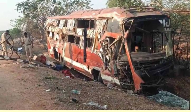
నిజామాబాద్, మార్చి 13 (తెలుగు రేఖ):