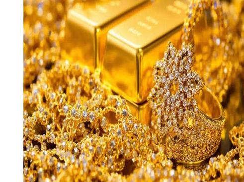
హైదరాబాద్, మార్చి 13 (తెలుగు రేఖ):

దేశీయ బులియన్ మార్కెట్లో బంగారం, వెండి ధరలు మరోసారి తగ్గుముఖం పట్టాయి. గురువారంతో పోలిస్టే నెతుకవారం నాటి మార్కెట్లో గోల్డ్, సిల్వర్ రేట్లు ఇంకాస్త దిగిపోయాయి. గుడి రిటర్న్స్ వెబ్సైట్ ప్రకారం.. శుక్రవారం ఉదయం 10 గంటల సమయంలో బంగారం, వెండి రేట్లను పరిశీల్చి.. 24 క్యారెట్ల 10 గ్రాముల పుత్రడి ధరపై రూ.980 పతనమై రూ.1,61,240కు చేరగా.. 22 క్యారెట్ల 10 గ్రాములపై రూ.900 తగ్గి రూ.1,47,800 వద్ద క్రేడవుతోంది. ఇక వెండి విషయానికొస్తే.. క్రీకం రోజుతో పోలిస్టే కిలో వెండిపై రూ.100 తగ్గింది. ప్రస్తుతం మార్కెట్లో కిలో వెండి ధర రూ.2,79,900గా ఉంది. అయితే.. గరిష్టాల వద్ద మదుపర్ణ లాభాల స్వీకరణకు దిగడమే ధరల తగ్గుదలకు కారణమని విశ్లేషకులు భావిస్తున్నారు.