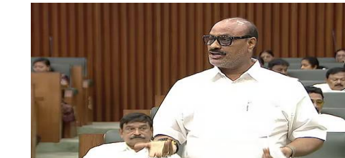
అమరావతి, ఫిబ్రవరి 24 (తెలుగురేఖ): పశు వైద్యశాలలో సౌకర్యాల, ఉపకరణాలను ఏర్పాటు చేస్తున్నామని మంత్రి అచ్చన్నాయుడు తెలిపారు. వైద్య శిబిరాలు ఏర్పాటుచేసి ఉచితంగా మందుల సరఫరా చేస్తున్నారన్నారు. ఆసెంబ్లీ సమావేశాల్లో ప్రశ్నోత్తరాలు సందర్భంగా రాష్ట్రంలోని పశు వైద్యశాలల్లో సౌకర్యాల కొరత, వైద్యుల నియామకాలపై పర్యాయ ఎమ్మెల్యే ఏలూరు సాంబశివరావు ప్రశ్నకు వ్యవసాయ శాఖ మంత్రి అచ్చన్నాయుడు సమాధానం ఇచ్చారు. వైసీపీ అధికారంలోకి వచ్చిన ముఖ్యమంత్రి అచ్చన్నాయుడు శాఖలకు తాళాలు వేశారు.. అన్ని శాఖల్లో నిర్వహణను పూర్తిగా గాలికి వదిలేశారని విమర్శించారు. ఇబ్బందులను సరిదిద్దేందుకు కూటమి ప్రభుత్వం చర్యలు చేపడుతోందని మంత్రి వివరించారు. వెలుర్నీ అనుపత్రల భవనాలు చాలా వరకు శిథిలమవుతున్న చేరాయని చెప్పారు. 2014-19 మధ్య కాలంలో నాబార్డ్ నిధులతో 326 భవనాలు మంజూరు చేశామని.. వాటిలో కొన్ని భవనాల నిర్మాణాలు అప్పుట్లో పూర్తి చేశామని గుర్తుచేశారు. అయితే.. వైసీపీ ప్రభుత్వం అధికారం చేపట్టక కొత్త భవనాల నిర్మాణం నిలిపివేసిందన్నారు. ఈ ఏడాది బడ్జెట్లో భవనాల మరమ్మత్తులు చేపడుతున్నామని తెలిపారు. త్వరలోనే వైద్యులు, సిబ్బంది నియామకాలు చేపడతామని మంత్రి అచ్చన్నాయుడు సభలో ప్రకటించారు.

- అవసరమైన ఉపకరణాల సరఫరా - అసెంబ్లీలో మంత్రి అచ్చన్నాయుడు