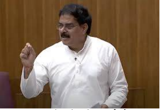
పరిస్థితిని మార్చాలనే ఉద్దేశంతో డిప్యూటీ సీఎం పవన్ కళ్యాణ్ 'అడవి తల్లి బాట' కార్యక్రమాన్ని చేపట్టారని నాదెండ్ల మనోహర్ వివరించారు. అలాగే ఒడిశా సరిహద్దులోని కొడియా గ్రామాల సమస్యను కౌణిణ్య రామకృష్ణ సభలో ప్రస్తావించారు. ఈ గ్రామాల ప్రజలు రెండు రాష్ట్రాల్లో ఓటుహక్కును కలిగి ఉన్నారు. అయితే.. ఏపీ అధికారులు అక్కడికి వెళ్లకుండా ఒడిశా పోలీసులు అడ్డుకుంటున్నారని ఆయన తెలిపారు. ఈ సమస్యపై ప్రభుత్వం జోక్యం చేసుకుని త్వరగా పరిష్కరించాలని ఎమ్మెల్యే కోరారు.

అమరావతి, ఫిబ్రవరి 24 (తెలుగురేఖ): గిరిజన గ్రామాల, కొండ ప్రాంతాల్లో రహదారి సౌకర్యాల కోసం 'అడవి తల్లి బాట' కార్యక్రమం చేపట్టినట్లు అసెంబ్లీలో మంత్రి నాదెండ్ల మనోహర్ తెలిపారు. రూ.1,077 కోట్లతో ఈ కార్యక్రమం అమలువుతుందని.. దీని ద్వారా సుమారు 4 వేల కిలోమీటర్ల మేర రహదారుల నిర్మాణం జరుగుతుందని మంత్రి వివరించారు. ఏపీ ఆసెంబ్లీ సమావేశాలు తొమ్మిదో రోజు ప్రారంభమయ్యాయి. సభ మొదలైన వెంటనే స్పీకర్ అయ్యప్పస్వామి ప్రశ్నోత్తరాలను చేపట్టారు. ఈ సందర్భంగా అసెంబ్లీలో మంత్రి కౌణిణ్య రామకృష్ణ 'అడవి తల్లి బాట' కార్యక్రమంపై ప్రశ్న లేవనెత్తారు. ఉపముఖ్యమంత్రి పవన్ కళ్యాణ్ సభలో లేకపోవడంతో పౌరసరఫరాల శాఖ మంత్రి నాదెండ్ల మనోహర్ సమాధానం ఇచ్చారు. మన్యం ప్రాంతంలో సరైన రోడ్లు లేకపోవడంతో గిరిజనలు తీవ్ర ఇబ్బందులు పడేవారని మంత్రి అన్నారు. అనారోగ్యానికి గురైనప్పుడు వైద్యం కోసం డోలీల ద్వారా రోగులను తరలించాల్సి వచ్చేదని చెప్పుకొచ్చారు. ఈ