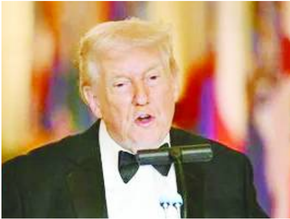
వాషింగ్టన్, ఫిబ్రవరి 24 తెలుగు రేఖ:

నేను ఎంతకాలం ఉంటానో తెలియట్లేదు' అని అమెరికా అధ్యక్షుడు డొనాల్డ్ ట్రంప్ అన్నారు. ఇటీవల ఘోరదాలోని తన నివాసంలోకి ఓ సాయుధ దుండగుడు చొరబడిన ఘటనపై స్పందిస్తూ ట్రంప్ ఈ వ్యాఖ్యలు చేశారు.