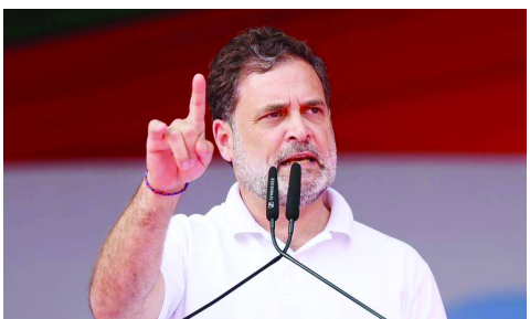
ఢిల్లీ, ఫిబ్రవరి 24 తెలుగు రేఖ:

భారత్-అమెరికా వాణిజ్య ఒప్పందంపై లోకసభలో వివక్ష నేత రాహుల్ గాంధీ మరోసారి ప్రధానమంత్రి నరేంద్ర