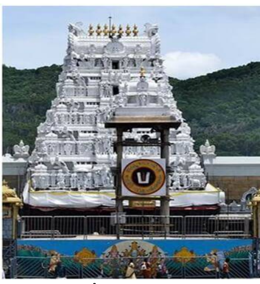
వారికి కఠిన శిక్ష వధేలా చూడాలని భక్తుల డిమాండ్ గా మారింది.