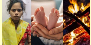
హైదరాబాద్, ఫిబ్రవరి 24 (తెలుగురేఖ):

దుండీగల్ పోలీస్ స్టేషన్ పరిధిలో మంగళవారం దారుణం చోటుచేసుకుంది. రెండు నెలల బాలుడిని కన్న తల్లి అత్యంత దారుణంగా హత్య చేసింది. బాలుడిని కట్టెల పాఠశాలలో వేసి కాల్చి చంపింది. ఏడవకుండా నోట్లో బట్టలు కుక్కి, కాళ్ళు కట్టిన మరీ హత్య చేసింది. బొరంపేట్ ప్రాంతంలో ఈ అమానుష ఘటన జరిగింది. ఈ ఘటనపై స్థానికుల పోలీసులకు సమాచారం ఇచ్చారు. దుండీగల్ పోలీసులు ఘటన స్థలానికి చేరుకుని పరిశీలించారు. కేసు నమోదు చేసి దర్యాప్తు చేస్తున్నారు. బాలుడి మృతదేహాన్ని గాంధీ ఆస్పత్రికి తరలించారు. బిహార్ కు చెందిన కుటుంబం బొరంపేట్లోని ఓ కన్స్ట్రక్షన్ సైట్ వద్ద పని చేస్తున్నట్లు సమాచారం. నవపాపాలు మోసిన బిడ్డను అతి దారుణంగా చంపడంపై స్థానికులు ఆశ్చర్యం వ్యక్తం చేస్తున్నారు. అసలు పనిబిడ్డను చంపడానికి ఆమెకు మనస్సు ఎలా వచ్చిందంటూ ఆవేదన వ్యక్తం చేస్తున్నారు. ఆ తల్లి ఇలా ఎందుకు చేసిందో తెలియాల్సి ఉంది. అలానే ఈ ఘటనకు సంబంధించి పూర్తి వివరాలు తెలియాల్సి ఉంది. పోలీసులు వివరాలు సేకరించారు.