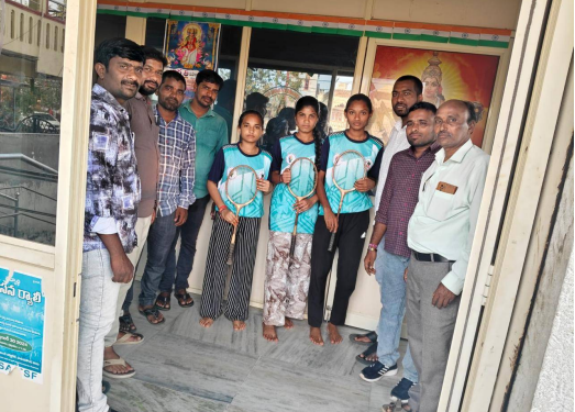
హనుమకొండ జిల్లా, ఫిబ్రవరి 24, తెలుగు రేఖ : హనుమకొండ జిల్లా నుండి రాష్ట్రస్థాయిలో బాల బ్యాడ్మింటన్