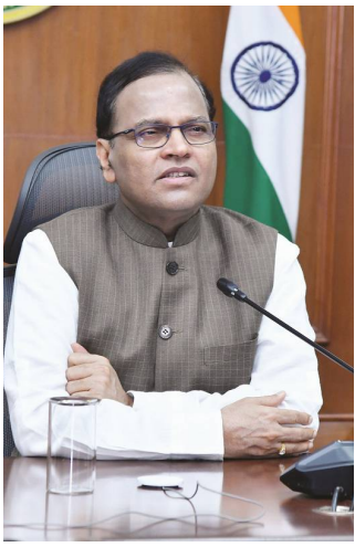
హైదరాబాద్, ఫిబ్రవరి 24 తెలుగు రేఖ:

రాష్ట్రంలో జరుగనున్న ఇంటర్ మీడియట్, ఎస్.ఎస్.సి పరీక్షలకు హాజరయ్యే విద్యార్థులకు ప్రత్యేక ప్రారంభం తర్వాత ఐదు నిమిషాల వరకు హాజరయ్యేందుకు అనుమతినిస్తున్నట్లు ప్రభుత్వం తెలిపింది. ఇంటర్, పదవ తరగతి పరీక్షల నిర్వహణపై రాష్ట్రంలోని జిల్లా కలెక్టర్లు, ఎస్.పీ లతో రాష్ట్ర