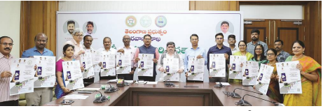
హైదరాబాద్, ఫిబ్రవరి 24 తెలుగు రేఖ: