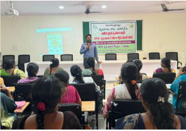
వివరించారు. అలాగే, ప్రకృతి వ్యవసాయ ఉత్పత్తులకు సర్టిఫికేషన్ పొందే విధానం మరియు మార్కెటింగ్ మోకకువలను కృషి సఖలకు తెలియజేశారు.

అక్షర విశేష గండేపల్లి : ప్రకృతి వ్యవసాయ పద్ధతులను పాటించడం ద్వారా అటు భూమి ఆరోగ్యాన్ని, ఇటు వాతావరణంలోని మిత్ర పురుగులను కాపాడుకోవచ్చని గడ్డిపల్లి కృషి విజ్ఞాన కేంద్రం (కేవీకే) శాస్త్రవేత్తలు స్పష్టం చేశారు. కృషి విజ్ఞాన కేంద్రం మరియు జిల్లా వ్యవసాయ శాఖ సంద్యక్ ఆధ్వర్యంలో 'కృషి సఖ' కోసం నిర్వహిస్తున్న ఐదవ రోజుల శిక్షణా శిబిరం బుధవారం రెండో రోజుకు చేరుకుంది.