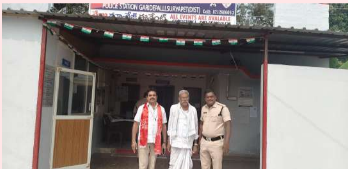
అక్షర విశేష గండేపల్లి : మిర్యాలగూడ మున్సిపాలిటీ ఎన్నికల ముఖ్యమంత్రి పర్వతన ఉండర్స్ సాకుతో ప్రజాస్వామ్యబద్ధంగా