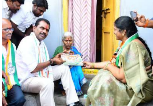
నాడు సంజోధం..నేడు సంక్షేమం...