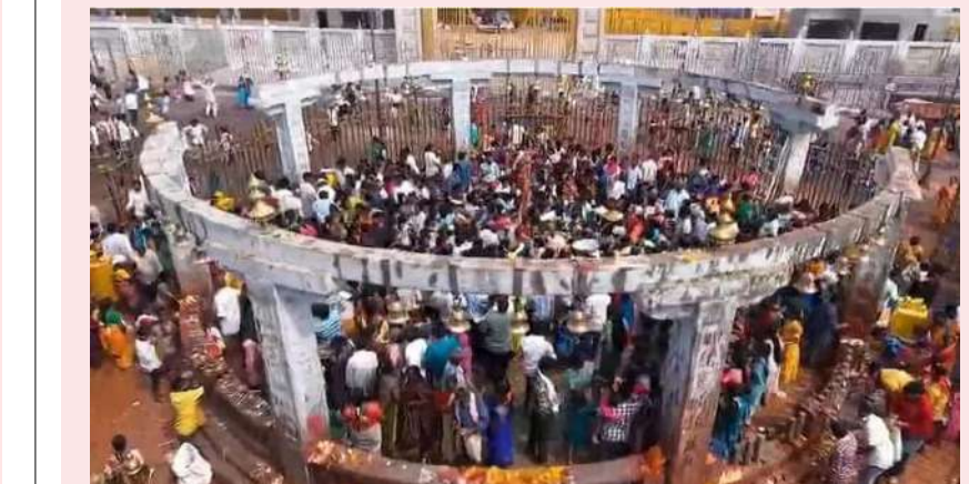
విజేత, మేడార ప్రతినిధి : తెలంగాణలో మేడారంలో ఘనంగా ముగిసిన తిరుగువారం మేడారం మహాజాతరలో కీలకమైన తిరుగువారం పండుగను బుధవారం ఘనంగా నిర్వహించారు. ఈ సందర్భంగా మేడారంలో సమృద్ధి కన్పిస్తోంది సారలమ్మ పూజారులు ప్రత్యేక పూజలు చేశారు. పూజారులు కుటుంబసమేతంగా వచ్చి తల్లూ గద్దలను, గుడి పరిసరాలను శుద్ధి చేసి, యాటను బలి ఇచ్చి మొక్కులు చెల్లించుకున్నారు. తిరుగువారంతో మేడారం మహాజాతర అధికారికంగా ముగిసిందని పూజారుల సంఘం ప్రకటించింది. కాగా మంత్రి శేకత్ కలెక్టర్ దివార డిఎస్, ఎస్సీ సుధీరాంనాథ్ అమ్మవార్లను దర్శించుకున్నారు.