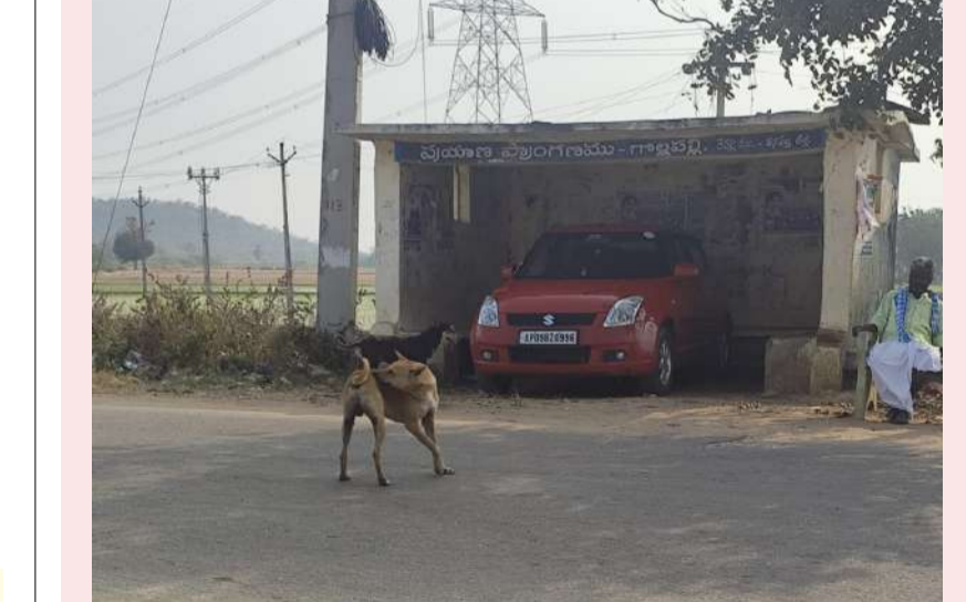
విజేత రేపల్లి, వనపర్తి, ప్రతినిధి : వనపర్తి జిల్లా విడుదల మండల పరిధిలోని గొల్లపల్లి బస్టాప్ ప్రయాణికుల ప్రాంగణంలో ఏపీ 09 బి జెడ్ 0996 అనే నెంబర్ గల రెడ్ కలర్ కారు బస్ స్టాప్ లో ప్రయాణికులు కూర్చునే స్థలంలో కారు పార్కింగ్ చేయడం పలువురిని ఆశ్చర్యానికి గురి చేసింది ఇది చూసిన వారంతా పార్కింగ్ చేయడానికి మరి ఎక్కడ స్థలం దొరకలేదా ఎంతో దబ్బు ఉంటే మాత్రం ఇలా బస్ స్టాప్ లో కారు పార్కింగ్ చేస్తా? అని చూసిన వారంతా అంటున్నారు