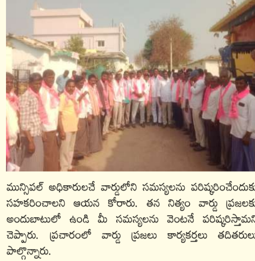
మున్సిపల్ అధికారులనే వార్డులోని సమస్యలను పరిష్కరించేందుకు సహకరించాలని ఆయన కోరారు. తన నిత్యం వార్డు ప్రజలకు అందుబాటులో ఉండి మీ సమస్యలను వెంటనే పరిష్కరిస్తామని చెప్పారు. ప్రచారంలో వార్డు ప్రజలు కార్యక్రమాల తదితరాలు పాల్గొన్నారు.