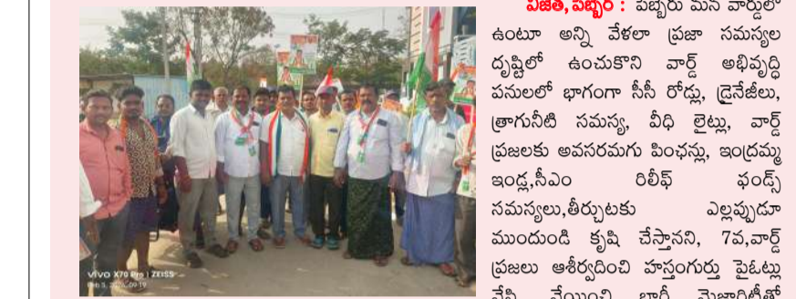
విజేత, పెన్నేర్ : పెన్నేరు మన వార్డులో ఉంటూ అన్ని వేళలా ప్రజా సమస్యల దృష్టిలో ఉంచుకొని వార్డ్ అభివృద్ధి పనులలో భాగంగా సీసీ రోడ్డు, డ్రైనేజీలు, ట్రాన్సిమిటి సమస్య, వీధి లైట్లు, వార్డ్ ప్రజలకు అవసరమగు పింఛన్లు, ఇంధనము ఇండ్ల, సీఎం రిలీఫ్ ఫండ్స్ సమస్యలు, తీర్పులు తెచ్చుకుంటూ ముందుడి కృషి చేస్తానని, 7వ,వార్డ్ ప్రజలు ఆశీర్వదించి హస్తం గుర్తు పైట్లు వేసి, వేయించి భారీ మెజారిటీతో