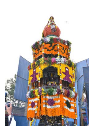
డిఐపిఆర్.ఆర్., నంద్యాల వారి ద్వారా జారీ