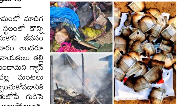
మంటలు వెలిగించడంతో ప్రమాదం నుంచి తప్పించుకోవడానికి బయటకు పరిగెత్తుకొచ్చింది అంతలోనే గుడిసె మొత్తం కూడా అగ్నిలో ఆహుతి అయిపోయింది.