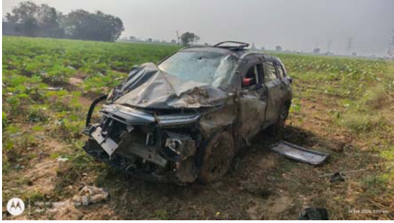
కారు బోల్తా పడటం వల్ల గాయం పాలయిన వ్యక్తిని చికిత్స పొందుతున్నారని తెలుస్తోంది.

మండలంలోని ముత్తలూరు గ్రామ సమీపంలోని మలుపు దగ్గర కారుబోల్తా పడటంతో ఒకరికి తీవ్ర గాయాలు అయినట్లు గ్రామస్థులు తెలిపారు. గ్రామస్థులు వివరాల మేరకు సోమవారం తెల్లవారుజామున సుమారు 2 గంటల సమయంలో ఆహోబిలం వైపు నుండి వస్తున్న కారు ముత్తలూరు టర్నింగ్ వద్ద ఉన్న అంజనేయ స్వామి గుడి దగ్గర ఒక్కసారిగా అదుపుతప్పి కాలువలోకి దూసుకెళ్లింది అన్నారు. ఈ ప్రమాదంలో కారుద్రైవర్ కి గాయాలు అయినట్లు గ్రామస్థులు తెలిపారు. ప్రమాదానికి కారణంగా తెలుస్తోంది. ఆహోబిలం బ్రహ్మోస్థానాలు ప్రారంభం అవుతున్న వేల భక్తులు వేలాదిగా తరలివస్తారని వాహనాలకు రోడ్డు మలుపుల వద్ద ప్రమాద సూచిక బోర్డులు ఏర్పాటు చేసి ప్రమాదాలు జరగకుండా అధికారులచర్యలు తీసుకోవాలని వాహనదారులు ప్రజలు కోరుతున్నారు.