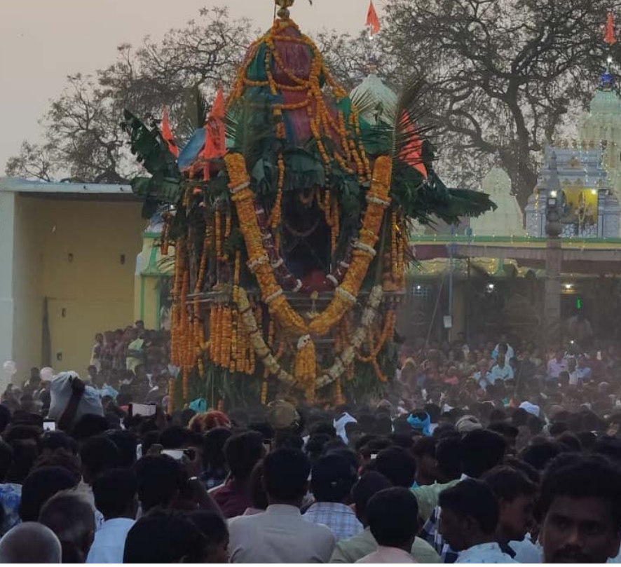
పెద్దఎత్తున హోజర్ మొక్కలను తీర్చుకున్న భక్తులు. భక్తులకొరకు అన్నదాన కార్యక్రమం ఏర్పాటు.