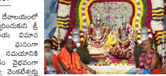
ఉదయం న్యూస్: దేవసాగర్ ఫిబ్రవరి 16