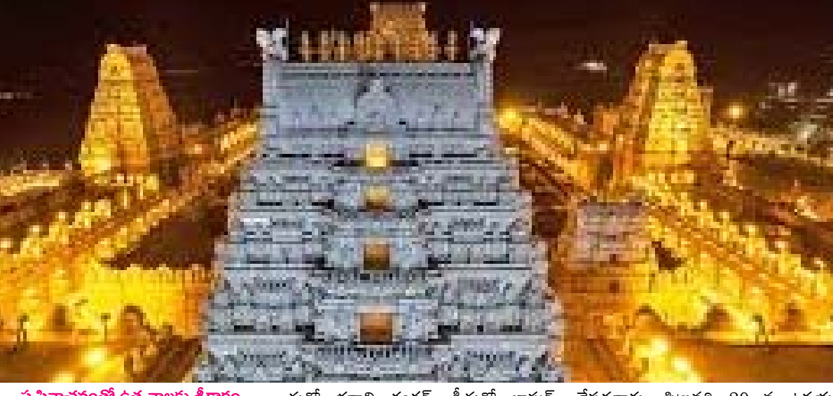
స్వస్తివాచనంతో ఉత్సవాలకు శ్రీకారం