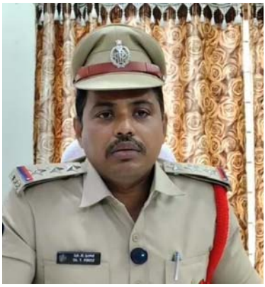
హైదరాబాద్ ప్రతినధి, ఉదయం న్యూస్