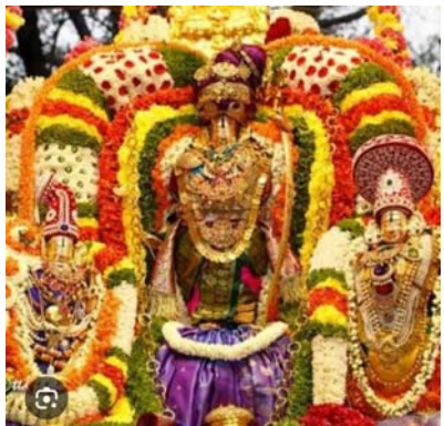
బడ్డెలు ఉదయం ప్రతినిధి

మార్చి 26న అంకురార్పణ, 27న ధ్వజారోహణం ఏప్రిల్ 1న శ్రీ సీతారాముల కల్యాణం టీటీడి జేఈవో వి. వీరబ్రహ్మం