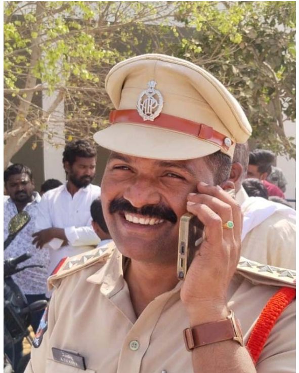
పత్తికొండ సూర్(ఉదయం న్యూస్)