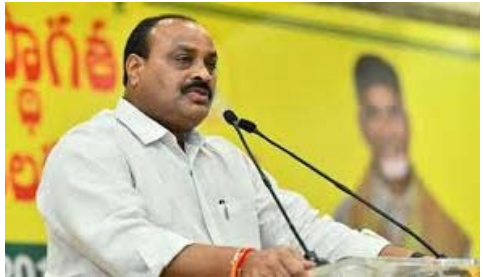
మండిపడ్డారు. తిరుమల లడ్డా నెయ్యిలో కల్పి జరిగిందని అన్ని నివేదికలు నిర్ధారించాయని, అందుకే కూటమి ప్రభుత్వం పాత టెండర్లను రద్దు చేసి కొత్త టెండర్లను పిలిచిందని మంత్రి వివరించారు. కొత్త టెండర్లలో కిలో

అమరావతి: వైసిపి నేతలు క్షమాపణలు చెప్పిన తరువాతే చర్యలు ప్రభుత్వం అంగీకరిస్తుందని మంత్రి అచ్చెన్నాయుడు స్పష్టం చేశారు. శాసనసభలో తిరుపతి లడ్డాలో కల్పి జరుగలేదని వైసిపి నాయకులు చెప్పింది అబద్ధమని మంత్రి ఆరోపించారు. కల్పి నెయ్యి అంశంపై చర్య జరపాలంటే ముందు వారు క్షమాపణ చెప్పాలని డిమాండ్ చేశారు. తిరుమల లడ్డా నెయ్యిలో కల్పి జరిగిందని మాజీ డిటీడీ చైర్మన్లు వైపి నుబ్బారెడ్డి, కరుణాకర్ రెడ్డి స్పష్టంగా చెప్పారని మంత్రి గుర్తు చేశారు. ఈ మేరకు వైసిపిపై మంత్రి అచ్చెన్నాయుడు తీవ్రస్థాయిలో ఆగ్రహం వ్యక్తం చేశారు. గురువారం మీడియాతో నిర్వహించిన చిట్చాట్లో మంత్రి మాట్లాడుతూ.. మూడు రోజుల నుంచి సంబంధం లేని విషయాలు తీసుకువచ్చి సభా సమయాన్ని వైసిపి సభ్యులు వృధా చేస్తున్నారని