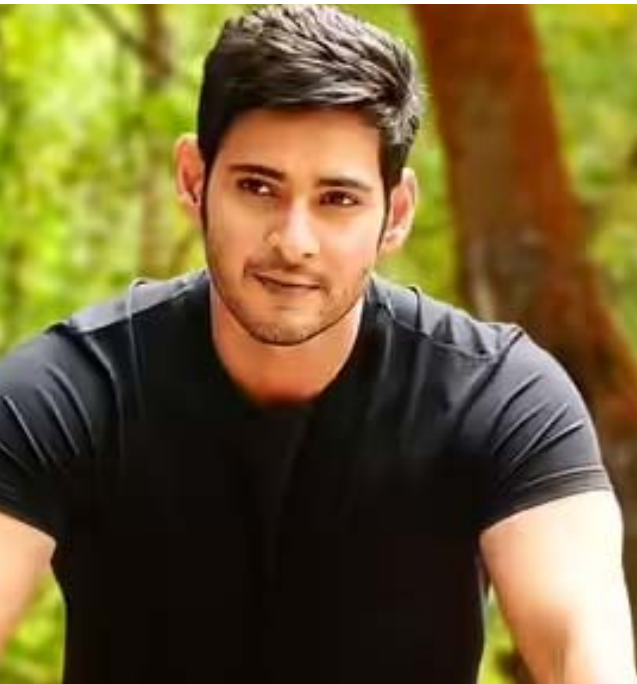
'వారణాసి' షూటింగ్ పార్ట్ పూర్తవుతుందని తెలుస్తోంది. తరువాత ఆ సినిమా షాట్స్ ప్రొడక్షన్ వర్క్ తో సాగుతుంది. మరి మహేశ్ బాబు తరువాత ఏ సినిమాలో నటించడానికి అంగీకరించారు అన్న అంశంపై ఫ్యాన్స్ తో పాటు సినీ లవర్స్ సైతం చర్చించుకుంటున్నారు. మహేశ్ తో సినిమా రూపొందించడానికి తెలుగు దర్శకులతో పాటు పలువురు పరభాషా దైర్యవంతుల సైతం ఆసక్తిగా ఉన్నారు. అయితే మహేశ్ మాత్రం మన తెలుగు దైర్యవంతుల సందేహాలను తిరస్కరిస్తూ గ్రీన్ సిగ్నల్ ఇచ్చినట్లు ఓ వార్త విశేషంగా వినిపిస్తోంది. సందేహాలను తిరస్కరిస్తూ 'లోనా' తన సత్య చాటుకుంటున్నారు. ప్రస్తుతం ప్రభాస్ హీరోగా సందేహాలను తిరస్కరిస్తూ 'లోనా' తన సత్య చాటుకుంటున్నారు. ప్రస్తుతం ప్రభాస్ హీరోగా సందేహాలను తిరస్కరిస్తూ 'లోనా' తన సత్య చాటుకుంటున్నారు.

మహేశ్ బాబు హీరోగా రాజమౌళి తెరకెక్కిస్తున్న 'వారణాసి' 2027 ఏప్రిల్ 7న రిలీజ్ కానుంది. అంటే ఇంకా సంవత్సరం పైగా ఉంది. ఈ సినిమా ప్రస్తుతం జాష్యూలో షూటింగ్ జరుపుకుంటోంది. ఈ యేడాది డిసెంబర్ లోగా