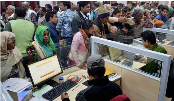
అరుణాచల్ ప్రదేశ్లో బ్యాంకులు బంద్. ఇక డిసెంబర్ 24న ఆదివారం, డిసెంబర్ 23 నాల్గవ శనివారం కాబట్టి.. ఇక్కడ 5 రోజుల వరకు సెలవులు ఉన్నాయని గమనించాలి. సమస్యలు ఎప్పుడు వస్తాయి, వాటి లక్షణాలు ఏంటి? అయితే బ్యాంకులకు సెలవులు ఉన్నప్పటికీ.. నెట్ బ్యాంకింగ్, మొబైల్ బ్యాంకింగ్ వంటి సేవలు పనిచేస్తాయి. ఏటీఎం లు, డిపాజిట్ మెషిన్లు కూడా అందుబాటులో ఉంటాయి. ఏదైనా కచ్చితంగా బ్యాంకులు వెళ్లి చేసుకోవాల్సిన పనులకు మాత్రం ఆటంకం కలుగుతుంది. అందుకే.. బ్యాంక్ సెలవుల్ని బట్టి పనుల్ని షెడ్యూల్ చేసుకోవడం ఉత్తమం. ఇక వచ్చే లక్షణాలు ఏంటి? అయితే బ్యాంకులకు సెలవులు ఉన్నప్పటికీ.. నెట్ బ్యాంకింగ్, మొబైల్ బ్యాంకింగ్ వంటి సేవలు పనిచేస్తాయి. ఏటీఎం లు, డిపాజిట్ మెషిన్లు కూడా అందుబాటులో ఉంటాయి. ఏదైనా

బ్యాంకులు ఆఖరి 10 రోజుల్లో ఎప్పుడెప్పుడు మూసివేసి ఉంటాయనే వివరాలు చూడాలి. బ్యాంకుల్లో చాలా మందికి ఎప్పుడూ ఏదో ఒక పని ఉంటుంది. డిసెంబర్ నెలలో ఈ సంవత్సరం ముగుస్తున్న సేవధ్యంలో చాలా ఆర్థిక కార్యకలాపాల కోసం బ్యాంకులతో పని ఉంటుంది. అందుకే ఏ రోజు సెలవు ఉంటుందో.. ఏ రోజు బ్యాంకు పని చేస్తుందో తెలుసుకొని దానికి అనుగుణంగా షెడ్యూల్ చేసుకోవాలి. ఇంకా కొన్ని స్పెషల్ ఫిక్స్డ్ డిపాజిట్లు వంటి వాటి గడువు కూడా చాలా బ్యాంకుల్లో డిసెంబర్ 31తో ముగుస్తోంది. అందుకే బ్యాంకు సెలవులు ఎప్పుడెప్పుడు ఎక్కడ ఉన్నాయో ఇక్కడ చూడండి. క్రిస్మస్ బ్యాంక్ సెలవులు.. ఎక్కడ.. ఎలా.. డిసెంబర్ 25 - సోమవారం - దేశవ్యాప్తంగా బ్యాంకులు బంద్. డిసెంబర్ 26 - మంగళవారం - క్రిస్మస్ సెలవేవే - మిజోరాం, అరుణాచల్ ప్రదేశ్, మేఘాలయల్లో బ్యాంకులు మూసివేసి ఉంటాయి. డిసెంబర్ 27 - బుధవారం - క్రిస్మస్ సందర్భంగా