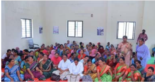
కార్యవరణలో భాగంగా గ్రామ, మండల, నియోజకవర్గ, జిల్లా, మరియు రాష్ట్ర స్థాయిలో ఐదు అంచెలగా కార్యక్రమాన్ని నిర్వహించడం జరుగుతుంది దానిలో

భాగంగా గురువారం జిల్లా వ్యాప్తంగా 508 గ్రామపంచాయతీలలో గ్రామ సభలు నిర్వహించడం జరుగుతుందని మరియు ఐదు మున్సిపాలిటీలలో వార్డు సభలు నిర్వహించడం జరుగుతుందని తెలిపారు. పేద ప్రజల అభివృద్ధి కోసం గ్రామాలు, పట్టణాలలో మౌలిక వసతులను కల్పించడమే కాకుండా మహాలక్ష్మి, గృహ జ్యోతి, ఇందిరమ్మ ఇండ్లు, పింఛన్లు, మహిళా స్వయం సహాయ సంఘాలకు వడ్డీ లేని రుణాలు, రైతు భరోసా, రైతు బీమా తదితర ప్రాధాన్యత కార్యక్రమాలను అమలు చేయడమే కాకుండా ఎదిగే వయసులో విద్యార్థులకు పాస్టాహారం అందించాలనే ఉద్దేశంతో ప్రభుత్వం సుతనంగా జూన్ నుండి ఇంటర్మీడియట్ విద్యార్థులకు మధ్యాహ్న భోజనం పథకం మరియు ప్రీ ప్రైమరీ స్కూల్ నుండి ఇంటర్మీడియట్ వరకు విద్యార్థులకు ఉదయం అల్పాహారం పథకం అమలు చేయడం జరుగుతుందని, ఇంటర్మీడియట్ చదివే విద్యార్థులకు విద్యార్థుల కొరకు వానా సౌకర్యం కల్పించడం జరుగుతుందని, కుటుంబ జీవిత బీమా కార్యక్రమాన్ని అమలు చేయడం జరిగిందని వివరించారు. ఈ కార్యక్రమంలో గ్రామ సర్పంచి, ఎంపీడీఎ, గ్రామ ఉపసర్పంచ్, పంచాయతీ కార్యదర్శి తదితరులు పాల్గొన్నారు.