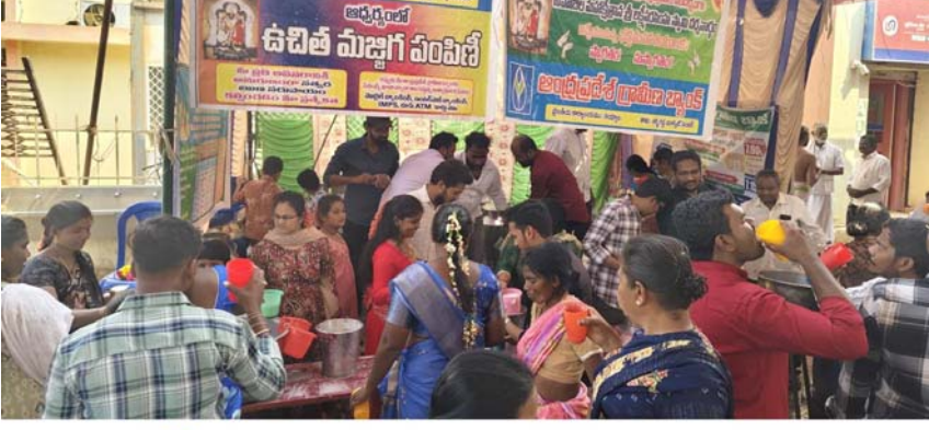
vivo V40 | 24mm f/1.88 1/100s ISO123