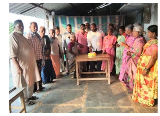
అత్యుక్తుల ఉదయం సూర్య