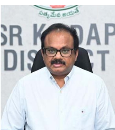
బద్వేలు ఉదయం ప్రతినిధి

అవసరమైతే టోల్ ఫ్రీ నంబర్: 08562- 246344 కు సంప్రదించి వివరాలు తెలియజేయండి ప్రభుత్వం తరఫున అవసరమైన సహాయ సహకారాలు అందించడానికి సిద్ధంగా ఉన్నాం: జిల్లా కలెక్టర్ డాక్టర్ శ్రీధర్ చెరుకూరి