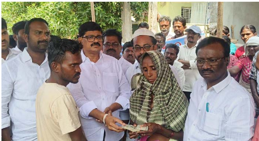
బద్వేలు ఉదయం ప్రతినిధి