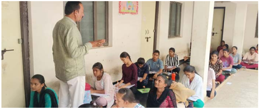
అక్షకూరు ఉదయం న్యూస్