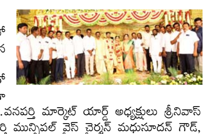
ఉదయం న్యూస్ వసంధి