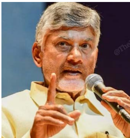
కోరుతున్నామని సీఎం తెలిపారు. 2023 లెక్కల ప్రకారం రాష్ట్రంలో ఏటా 6.70 లక్షల జననాలు సమాధానం చేయబడ్డాయి తెలిపారు. ఇలాగే కొనసాగితే 2047 నాటికి జనాభాలో 23 శాతం మంది వృద్ధులు

అమరావతి: జపాన్, దక్షిణ కొరియా, ఇటలీ లాంటి దేశాల్లో ఫర్టిలిటీ రేట్ తగ్గుతోంది.. భారత్లో పాటు ఏపీ లాంటి రాష్ట్రాల్లోనూ ఈ తరహా పరిస్థితి నెలకొంది ముఖ్యమంత్రి నారా చంద్రబాబు నాయుడు వెల్లడించారు. ప్రస్తుతం రాష్ట్రంలో లోబల్ ఫెర్టిలిటీ రేట్ 1.5గా ఉంది.. 1993లో ఇది 3.0గా సమాధానం సీఎం వివరించారు. డివెల్ప్మెంట్ వేగంగా తగ్గితే పని చేసే వయస్సులో ఉన్నవారి సంఖ్య గణనీయంగా తగ్గి, ఆర్థిక వృద్ధి మందగిస్తుందని హెచ్చరించారు. ప్రభుత్వం జోక్యం చేసుకోకపోతే ఆర్థిక వృద్ధికి నష్టం వాటిల్లే అవకాశం ఉందని చెప్పారు. ఏపీ శాసనసభలో పాపలేషన్ మేనేజ్మెంట్ పాలసీపై ముఖ్యమంత్రి నారా చంద్రబాబు నాయుడు కీలక ప్రకటన చేశారు. ఏపీకి అత్యంత కీలకమైన పాలసీని శాసనసభలో ప్రకటించారు. ఇప్పటి వరకు ఫ్యామిలీ ప్లానింగ్కు ప్రాధాన్యం ఇచ్చామని.. ఇకపై పాపలేషన్ కేర్ వైపు దృష్టి సారించాల్సి ఉందన్నారు. ప్రస్తుతం డ్రాఫ్ట్ పాలసీని శాసనసభలో ప్రవేశపెట్టి ప్రజల ముందు ఉంచుతున్నామని వివరించారు. దీనిపై నెలరోజుల పాటు విస్తృత చర్చ జరగాలని