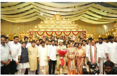
ఉదయం న్యూస్ వసంధి.