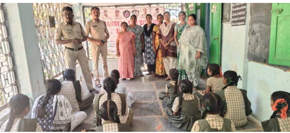
నంద్యాల మార్చి 5:- ఉదయం న్యూస్ ప్రతినధి