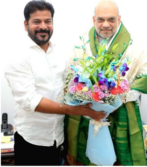
వివరించారు. ప్రస్తుతం రాష్ట్రంలో 83 మంది ఐపీఎస్ అధికారులు

తెలంగాణ రాష్ట్ర అవసరాలకు అనుగుణంగా ఐపీఎస్ అధికారుల సంఖ్యను పెంచి కేటాయించాలని ముఖ్యమంత్రి ఎ. రేవంత్ రెడ్డి కేంద్ర హోం శాఖ మంత్రి అమిత్ షాను కోరారు. ఢిల్లీ పర్యటన సందర్భంగా ఆయన అమిత్ షాతో భేటీ అయి రాష్ట్ర పోలీసింగ్ కు సంబంధించిన పలు ముఖ్య అంశాలను చర్చించారు. రాష్ట్ర విభజన అనంతరం 2016లో మొదటి క్యాడర్ రివ్యూ జరిగిందని, 2021లో జరగాల్సిన రెండో క్యాడర్ రివ్యూ అలసత్వంగా 2025లో నిర్వహించాలని సీఎం గుర్తుచేశారు. ఆ సమయంలో తెలంగాణకు కేవలం ఏడుగురు ఐపీఎస్ అధికారులనే అదనంగా కేటాయించారని తెలిపారు.