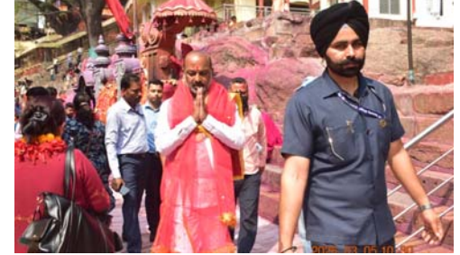
హైదరాబాద్ ప్రతినధి, ఉదయం న్యూస్