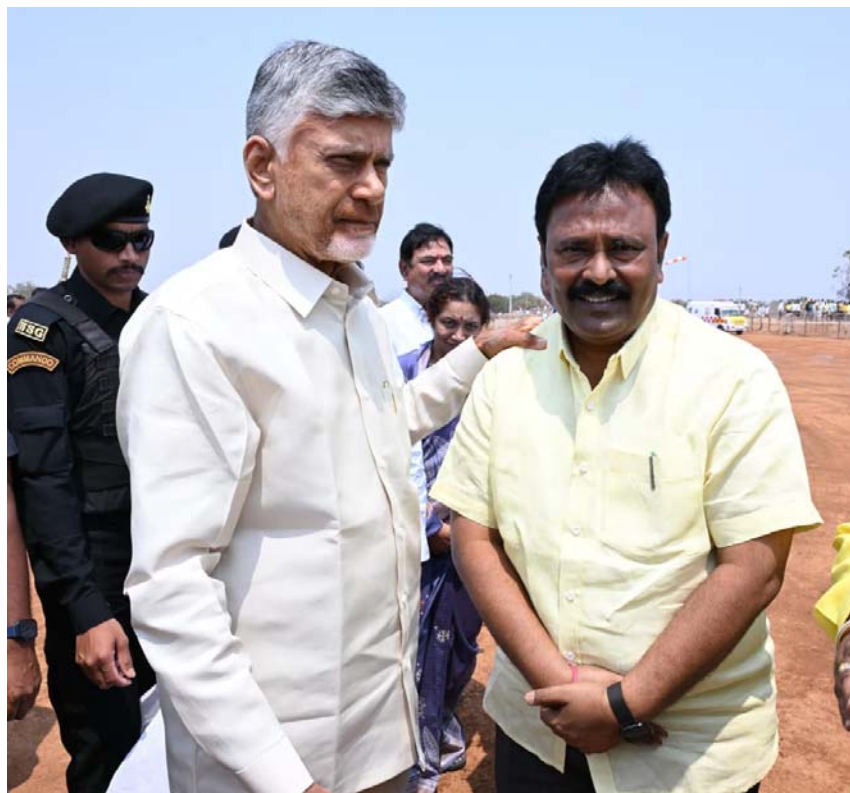
ఉత్తేజ ప్రతినధి నందికొట్కూరు మార్చి 9 :

పట్టాదారు పాను పుస్తకాల పంపిణీ కార్యక్రమంలో భాగంగా నేడు డోన్ నియోజకవర్గంలోని కొత్తబురుజు గ్రామానికి విచ్చేసిన ముఖ్యమంత్రి నారా చంద్రబాబు నాయుడు కి హెలికాప్టర్ వద్ద మంత్రులు, ఎమ్మెల్యేలు, కూటమి నాయకులు మరియు అధికారులతో కలిసి ఘన స్వాగతం పలికిన నందికొట్కూరు నియోజకవర్గ ఎమ్మెల్యే గీత జయసూర్య