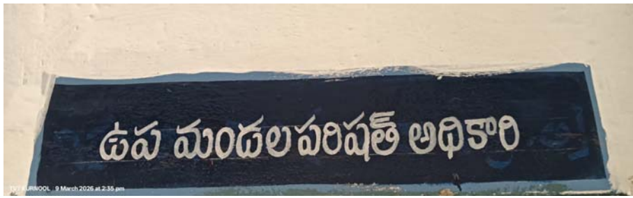
ఉత్తేజ న్యూస్ మార్చి 09 కర్నూలు

ఆంధ్రప్రదేశ్ రాష్ట్రంలో గ్రామ వార్డు సచివాలయాలను పర్యవేక్షించుటకు మండల కార్యాలయాలలో సీనియర్ అసిస్టెంట్లుగా, గ్రేడ్ 1 పంచాయతీ కార్యదర్శులుగా, విలేజ్ డెవలప్మెంట్ అధికారులుగా, విద్యుల నిర్వహిస్తున్న వారికి, ఆంధ్రప్రదేశ్ ప్రభుత్వం గత సంవత్సరం 2025 నవంబర్ 29 తేదీన రాష్ట్రవ్యాప్తంగా 660 ఉద్యోగులను డిప్యూటీ ఎంపీడీవోలుగా పదోన్నతి కల్పించారు. అయితే మూడు నెలలు గడుస్తున్న ఇంకా పాజిషన్ ఐడి క్రియేట్ చేయలేదని, వేతనాలు చెల్లించలేదని, అధికారులు ఆవేదన చెందుతున్నారు! మూడు నెలలుగా వేతనాలు కుటుంబాలను పోషించుకోవడానికి కూడా భారంగా ఉందని బాధను వ్యక్తపరుస్తున్నారు. ప్రభుత్వం స్పందించి వారి సమస్యను తీర్చాలని వేచి చూడాల!