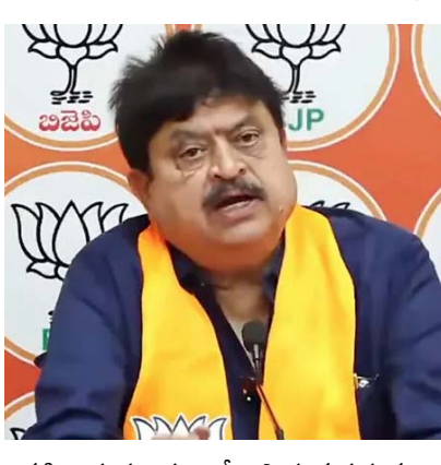
ఒకటి చొప్పున ఐదు భారీ బహిరంగ సభలకు ప్లాన్ చేస్తున్నారని జేపీ నర్సా, రాజ్ నాథ్ సింగ్ లాంటి వారి సభల కోసం బీఎల్ సంతోషికి ప్రతిపాదనలు వంపా అని అన్నారు.

హైదరాబాద్: తెలంగాణలో బీఆర్ఎస్, కాంగ్రెస్ కావాలని బీజేపీ తప్పుడు ప్రచారాలు చేస్తున్నాయని ఆరోపించారు రాష్ట్ర బీజేపీ చీఫ్ రామచందర్ రావు. సింగరేణి నైసీ కోల్ టెండర్ల అంశంపై విచారణ జరగాల్సిందేనని డిమాండ్ చేశారు. కాంగ్రెస్ నేతలు దావోస్ వెళ్లి ఏం చేస్తున్నారని ప్రశ్నించారు. బీజేపీ రాష్ట్ర కార్యాలయంలో పార్టీ పదాధికారుల సమావేశం జరిగింది. ఈ సమావేశంలో పార్టీ రాష్ట్ర కమిటీ తీరుపై ప్రధానంగా చర్చించారు. రాష్ట్ర కమిటీ సభ్యులకు బాధ్యతలు అప్పగించి నాలుగు నెలలు పూర్తి అనుబంధ విభాగాల పనితీరుపై ఆయన సమీక్ష చేశారు. ఈ క్రమంలో రాష్ట్ర కమిటీ పనితీరుపై రామచందర్ రావు అసంతృప్తి వ్యక్తం చేశారు. అనంతరం, రామచందర్ రావు మాట్లాడుతూ.. బీజేపీ అగ్రనేతలతో రెండు ఉమ్మడి జిల్లాలకు