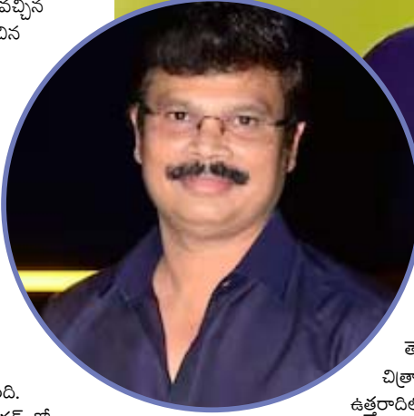
తీసిన తెలుగు చిత్రాలకు ఉత్తరాదిలో కూడా మంచి ఆదరణ

టాలీవుడ్ ఊర మాన్ సినిమాల స్పెషలిస్ట్ డైరెక్టర్ బోయ పాటి శ్రీను. కెరీర్ ప్రారంభం నుంచి తనదైన పంథాలో సినిమాలు చేస్తూ వస్తున్నారు. ఆ విధం గానే ఎన్నో ఖ్యాతి బిస్టర్ హిట్లు అందుకున్నారు. కొన్ని డిజాస్టర్లు కూడా చవిచూశారు. చివరగా ఆయననుంచి వచ్చిన 'అఖండ 2: తాండవం' చిత్రం ఆశించిన స్ట్రాయిలో వనాక్షను రాబట్టలేకపోయింది. దీంతో బోయపాటి నెక్స్ట్ మూవీ ఏంటి? ఏ హీరో డేట్స్ ఇస్తాడు? అనే చర్చలు జరుగుతున్నాయి. ఈ నేపథ్యంలో దర్శకుడి తదుపరి ప్రాజెక్ట్ పై ఓ శ్రేణి స్టూన్ సోపల్ మీడియాలో చక్కర్లు కొడుతోంది.