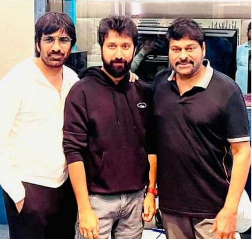
ఏప్రిల్ 20, 2026 నుంచి ప్రారంభం కానుంది. ఇప్పటికే ట్రి-ప్రాడక్షన్ పనులు పూర్తయ్యాయి. బెంగాల్ బ్యాక్ డ్రాప్ లో తండ్రికూతుళ్ల భావోద్వేగాలతో కూడిన మాస్ యాక్షన్ ఎంటర్టైనర్ గా ఈ కథను రూపొందించినట్లు సమాచారం. ఈ సినిమాను వచ్చే ఏడాది సంత్రాంతి కానుకగా విడుదల చేయాలని మేకర్స్ ప్లాన్ చేస్తున్నారు. ఈ చిత్రాన్ని ప్రముఖ నిర్మాణ సంస్థ కేపీఎస్ ప్రొడక్షన్స్ అత్యంత భారీ బడ్జెట్ తో ప్రతిష్టాత్మకంగా నిర్మిస్తోంది. టాలీవుడ్ మాత్రమే కాకుండా ఇతర ఇండస్ట్రీల నుంచి

మన శంకర వరప్రసాద్ గారు అనే చిత్రంతో మంచి హిట్ కొట్టిన చిరంజీవి ఇప్పుడు మరో భారీ ప్రాజెక్ట్ తో అభిమానులను అలరించేందుకు సిద్ధమవుతున్నారు. ఈ చిత్రం తన కెరీర్ లో 158వ చిత్రంగా రూపొందుతుంది. ఈ చిత్రాన్ని