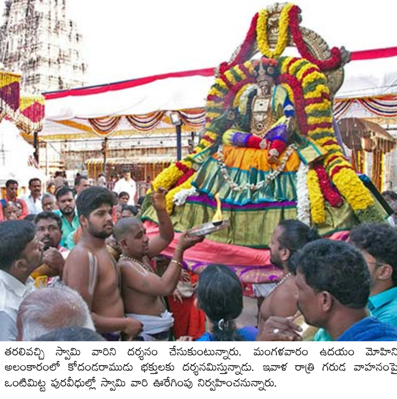
తరలివచ్చి స్వామి వారిని దర్శనం చేసుకుంటున్నారు. మంగళవారం ఉదయం మోహినీ అలంకారంలో కోదండరాముడు భక్తులకు దర్శనమిస్తున్నాడు. ఇవాళ రాత్రి గురు వాహనంపై ఒంటిమిట్ట పురవీధుల్లో స్వామి వారి ఊరేగింపు నిర్వహించనున్నారు.