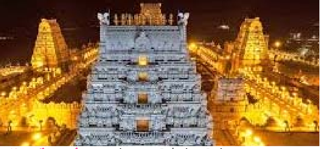
స్వస్తిచందనంతో ఉత్సవాలకు శ్రీకారం