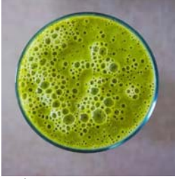
ప్రాన్టీల్ క్యాన్సర్ ముప్పును తగ్గించేందుకు తాజా అధ్యయనాలు చెబుతున్నాయి.