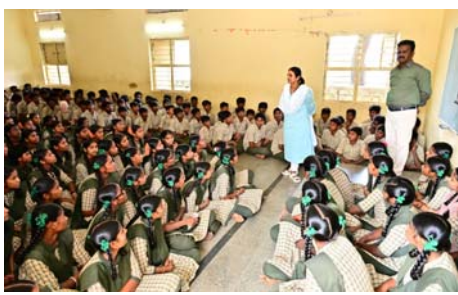
కర్నూలు జిల్లా ఉత్తేజిత ప్రతినిధి