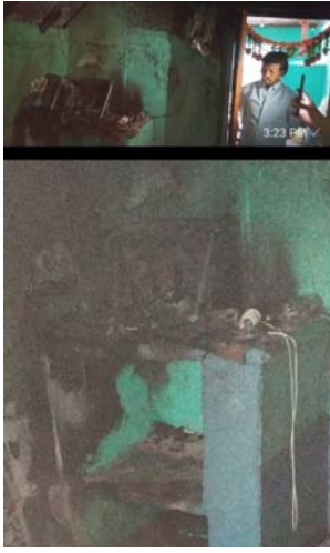
కర్నూలు జిల్లా ఉత్తేజిత ప్రతినిధి