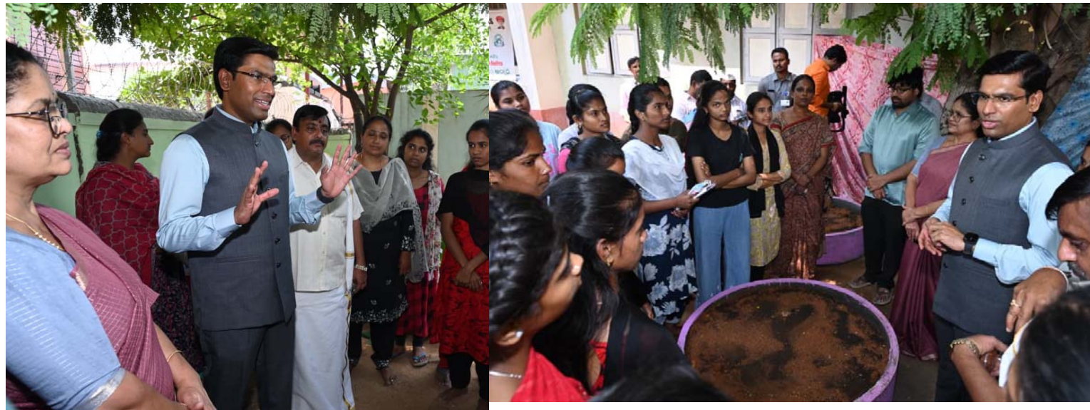
తిరుపతిలోని బీసీ వెల్డర్ హాస్టల్లో తడి-పాడి చెత్త వేరు చేసి ఎరువుగా వినియోగం

అన్ని హాస్టళ్లు, ఆసుపత్రులు, సంక్షేమ సంస్థల్లో జీరో వేస్ట్ కార్యక్రమం అమలు చేయాలి