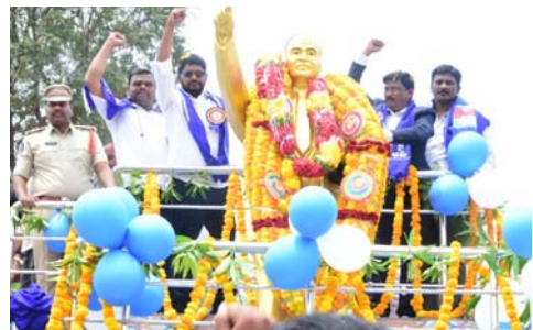
అంబేద్కర్ ఆశయాలు కొనసాగించాలి.

భవిష్యత్ తరాలకు అంబేద్కర్ చేసిన కృషిని తెలియజేసేందుకు విగ్రహాల ఏర్పాటు.