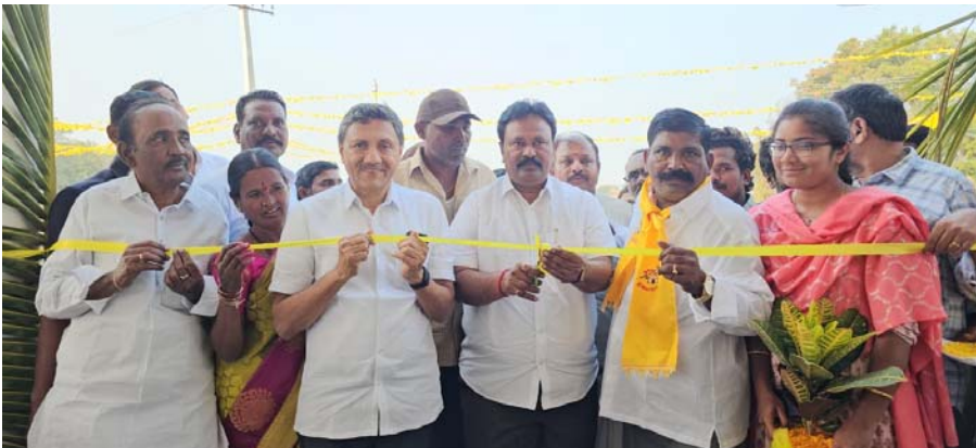
ఉత్తేజిత ప్రతినిధి నందికొట్కూరు జనవరి 2:

: ముఖ్య అతిథులుగా మాండ్రా శివానందరెడ్డి ఎమ్మెల్యే గీత్ర జయసూర్య