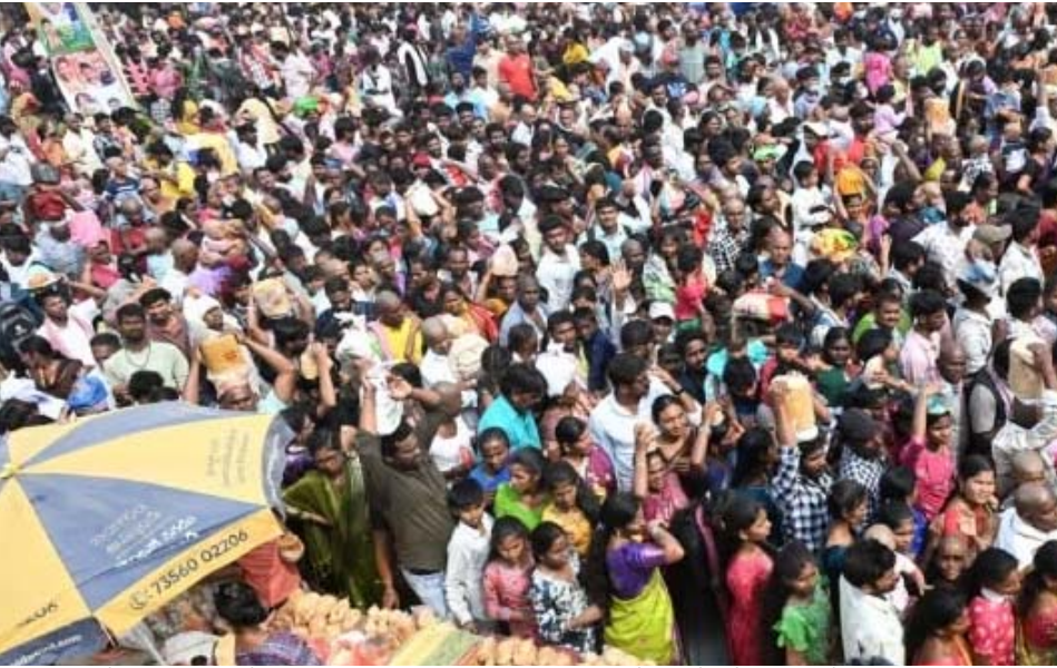
నుంచే కాకుండా దేశం నలుమూలల నుంచి పెద్ద ఎత్తున తరలివచ్చి అమ్మవార్లను దర్శించుకున్నారు. తల్లుల వనప్రవేశంతో వన జాతర పూర్తయింది. సాయంత్రం సమయంలో గడ్డలను పరిశుభ్రం చేసి, గిరిజన పూజారులు అమ్మవార్లకు సంప్రదాయ పూజలను నిర్వహించారు. అనంతరం రాత్రి 7 గంటల సమయంలో డోల వాయిద్యాలు, డప్పు చప్పుళ్ల నడుమ దేవతల వనప్రవేశం కార్యక్రమం ఆరంభమయింది.