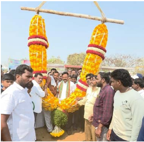
ఉత్తేజిత ప్రతినిధి, నందికొట్కూరు మార్చి 02

నంద్యాల జిల్లా నందికొట్కూరు మండలం కాణిదేల గ్రామంలో శ్రీశ్రీ శ్రీ భ్రమరాంబ మల్లికార్జున తిరణాల సందర్భంగా నిర్వహించిన పెద్ద బండ ఎద్దుల బండలారుడు పోటీలు ఘనంగా ప్రారంభమయ్యాయి. ఈ వేడుకలకు నందికొట్కూరు నియోజకవర్గ ఎమ్మెల్యే