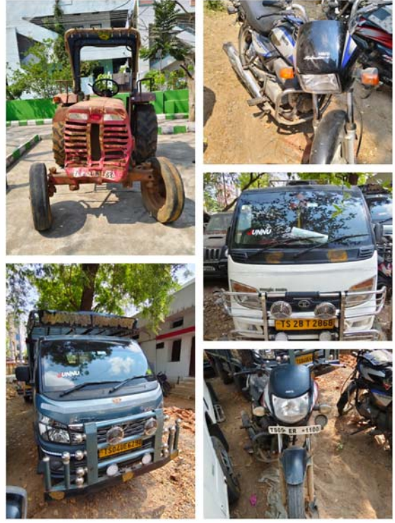
భూదాన్, ప్రభుత్వ భూముల దురాక్రమణదారుల ఐదు వాహనాలు సీజ్.