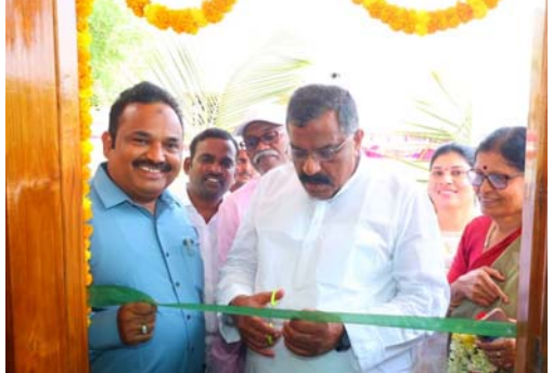
భావిస్తూ గృహనిర్మాణ రంగంలో ప్రభుత్వం విస్తృత స్థాయిలో కార్యక్రమాలు చేపట్టిందని తెలిపారు. ఇప్పటికే మొదటి విడతగా 2025 నవంబర్ 12న రాష్ట్రవ్యాప్తంగా మొత్తం 3,00,192 గృహాలను అభిదారులకు అందజేసిన ప్రభుత్వం, రెండో విడతలో భాగంగా మరో