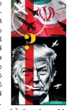
అందుకే దాడులను ఆపుకోజులు వాయిదా వేస్తున్నామని ట్రంప్ ప్రకటించారు. ఒక మహాసామ్రాజ్యం క్షిణింపను ప్రయోగించింది. ఒక పూతన నాగరికత ఆ దాక్షిణ్య తట్టుకొని నిలబడింది. ఇది ఏడువేల ఏళ్ల చరిత్ర వర్సెస్ రెండువందల ఏళ్ల ఆధికారం! ఇరాన్ పీఠభూమిలో 7,000 ఏళ్ల నుంచే మానవ ఆవాసం ఉంది. క్రీస్తుపూర్వం 3200 నాటికే అక్కడ ఒక గొప్ప నాగరికత విలసిల్లింది. క్రీస్తుపూర్వం 6వ శతాబ్దంలో ‘సైరెస్’ పాలనలో పర్షియన్ సామ్రాజ్యం ప్రపంచంలోనే అతిపెద్ద శక్తిగా ఎదిగింది. గ్రీస్, ఈజిప్ట్, టర్కీ ఇలాగే నుంచి మన పక్కనే ఉన్న పాకిస్థాన్ వరకు అది విస్తరించింది. క్రీస్తుపూర్వం 539లో, యుద్ధం లేకుండానే బాబెలోన్ ను సైరెస్ జయించారు. అక్కడి ప్రజల్లో కోట తలుపులు తెరిచి ఆయనకు స్వాగతం పలికారు. ఆ సమయంలో సైరెస్ తన ఆజ్ఞను ఒక స్తూపంపై రాయించారు. ప్రస్తుతం బ్రిటిష్ మ్యూజియంలో ఉన్న ఆ స్తూపాన్ని, 1971లో బక్రూజ్ సమితి ప్రపంచంలోనే మొదటి మానవ హక్కుల ప్రకటనగా గుర్తించింది. ఆ సైరెస్ స్తూపం ప్రకారం.. ఆయన బానిసలందరికీ విముక్తిని, మతస్వేచ్ఛను, సమానత్వాన్ని ప్రసాదించారు. ఓపిట్రా బైబిల్ లో యూదుడు కాని వ్యక్తిని ‘చక్కయ్య’ (దేవుని చే ఎన్నుకోబడిన వాడు) అని పిలిచారంటే తీవ్రం సైరెస్ ను మాత్రమే సైరెస్ చెప్పలేని చక్కయ్య మానవ హక్కుల ప్రకటించింది. 2,315 ఏళ్ల తర్వాత (1776లో) వచ్చిన ఆమెరికా.. ఇప్పుడు అదే నాగరికతను గగనతలం నుంచి నామరూపాలు లేకుండా చేయాలని చూస్తోంది. సైరెస్ పతనం వెలువడిన 2,487 ఏళ్ల తర్వాత (1948లో) ఏర్పడిన ఇజ్రాయెల్.. తన భద్రత పేరుతో ఆ నాగరికతను లొంగి దీసుకోవాలని ప్రయత్నిస్తోంది. పాతికరోజుల పాటు సాగిన ఈ వైమానిక దాడులు ఇరాన్ సుదీర్ఘచరిత్రలో ఒక చేదు అధ్యాయం మాత్రమే కాని, ఆమెరికాకు మాత్రం ఇలాంటి యుద్ధం ఊహకందని విషయం. క్రీస్తుపూర్వం 330లో అలెగ్జాండర్ ‘పెర్షియన్’ నగరాన్ని తగులబెట్టాడు. 13వ శతాబ్దంలో మంగోలులు ఇరాన్ నగరాలపై విరుచుకుపడి, కొన్ని ప్రాంతాల్లో ముస్లింలను పంతు జనాభాను ఊచకోత చేశారు. ఇది 1953లో బ్రిటిష్ కులీ ప్రజాస్వామ్యభద్రంగా నిర్మితమైన మొదటి ముహమ్మద్ మొసాద్దెగ్ ను గెలిచింది. 1980లో ఆమెరికా అందించిన ఆయుధాలతో ఇరాన్.. ఇరాన్ పై ఎనిమిదేళ్ల పాటు సాగించిన యుద్ధంలో లక్షలాది మంది ఇరానియులు బలయ్యారు. అయినా సరే, ఇరాన్ ఇంకా ఉంది. పర్షియా ఎప్పుడూ ఇక్కడే ఉంది. ఇప్పుడు బాంబుల దాడికి గురవుతున్న అవిసెన్నా (ఇబ్న్ సీనా) వంటి మహానియుల నాగరికత, ఆయన రాసిన ‘కానన్ ఆఫ్ మెడిసిన్’ గ్రంథం ఆరు శతాబ్దాల పాటు యూరప్ విశ్వవిద్యాలయాల్లో ప్రధాన వైద్య పాఠ్యపుస్తకంగా ఉండేది.