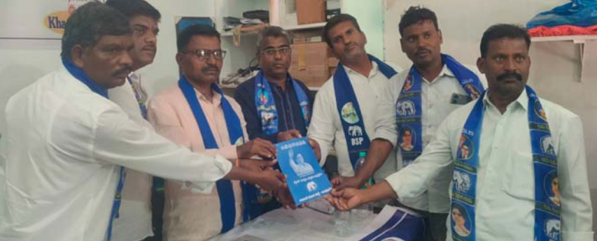
కర్నూలు జిల్లా ఉత్తేజిత ప్రతినిధి