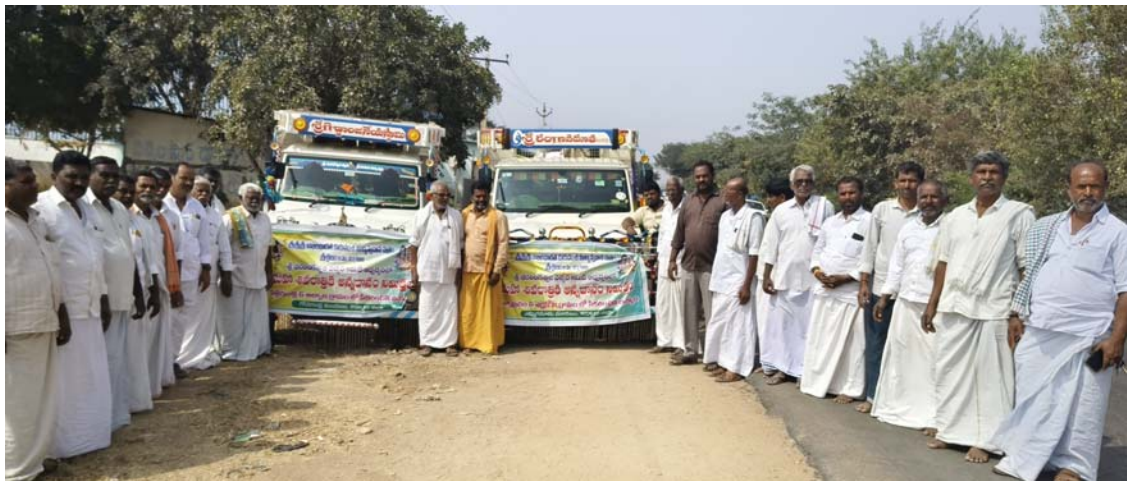
కర్నూలు జిల్లా ఉత్తేజిత ప్రతినిధి