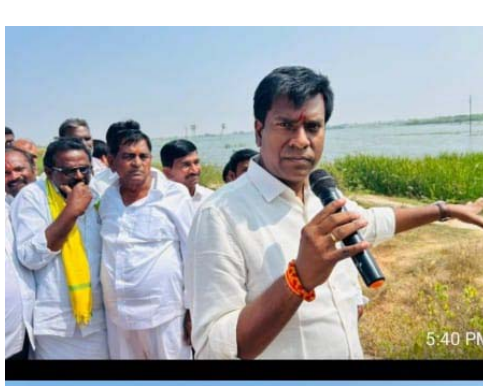
కర్నూలు జిల్లా ఉత్తేజిత ప్రతినిధి