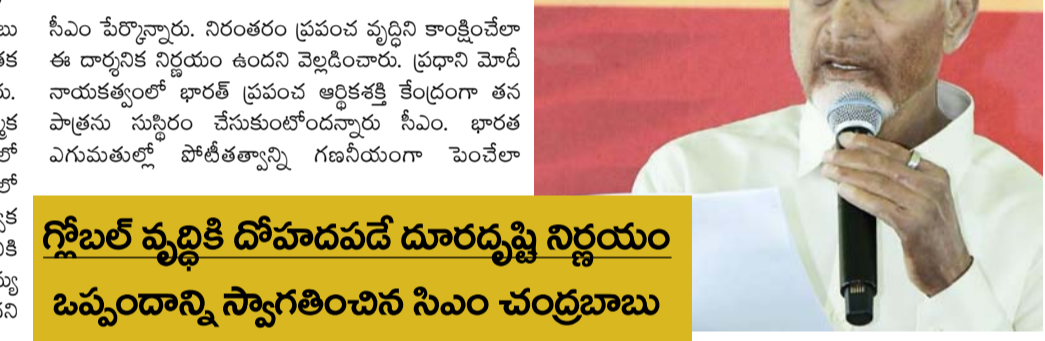
గ్లోబల్ వృద్ధికి దోహదపడే దూరదృష్టి నిర్ణయం ఒప్పందాన్ని స్వాగతించిన సీఎం చంద్రబాబు

అమరావతి: అమెరికాతో భారత్ వాణిజ్య ఒప్పందం ప్రపంచ ఆర్థిక స్థిరత్వానికి ఒక చారిత్రక మైలు రాయి అని సీఎం చంద్రబాబు అన్నారు. దీన్ని విజయవంతంగా పూర్తిచేసినందుకు ప్రధాని మోదీకి అభినందనలు తెలిపారు. టారిఫ్లను 18 శాతంకు తగ్గించడం ప్రపంచంలోని రెండు గొప్ప ప్రజాస్వామ్య దేశాల మధ్య బంధాన్ని మరింత బలోపేతం చేస్తుందన్నారు. ఇది నిరంతర గ్లోబల్ వృద్ధికి దోహదపడే దూరదృష్టి నిర్ణయమని చెప్పారు. మోదీ నాయకత్వంలో భారత్ ఒక గ్లోబల్ ఆర్థిక శక్తిగా తన స్థానం మరింత పటిష్టం చేసుకుంటోందన్నారు. ఈ ఒప్పందం భారత్ ఎగుమతుల పోటీ సామర్థ్యాన్ని గణనీయంగా పెంచుతుందని చెప్పారు. ముఖ్యంగా ఏపీలోని యువత, రైతులకు విస్తృత అవకాశాలను సృష్టించనుందని చంద్రబాబు పేర్కొన్నారు. భారత్ - అమెరికాల మధ్య కుదిరిన చారిత్రక వాణిజ్య ఒప్పందాన్ని చంద్రబాబు నాయుడు స్వాగతించారు. ఈ ఒప్పందం ప్రపంచ ఆర్థిక స్థిరత్వానికి చారిత్రాత్మక మైలురాయి అని ఆయన సామాజిక మాధ్యమం ఎక్స్ లో పేర్కొన్నారు. ప్రధానమంత్రి నరేంద్ర మోదీ నాయకత్వంలో ఈ ఒప్పందం కుదిరడంపై సీఎం హృదయపూర్వక అభినందనలు తెలిపారు. సుంకాలను 18 శాతానికి తగ్గించడం ద్వారా ప్రపంచంలోని రెండు గొప్ప ప్రజాస్వామ్య దేశాల మధ్య బంధాన్ని మరింత బలోపేతం చేస్తుందని