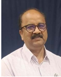
జేతంచెర్ల : ఉత్తేజిత ప్రతినిధి