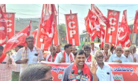
అవినీతి, లక్ష్యమాలకు, దోపిడీకి కేరాఫ్ అప్రెస్ తాహసీల్దార్ కార్యాలయం కబ్జాలో నుండి వీడల స్థలాలను కాపాడాలని ధర్మాసేవకు కర్నూలు జిల్లా ఉత్తేజిత ప్రతినిధి