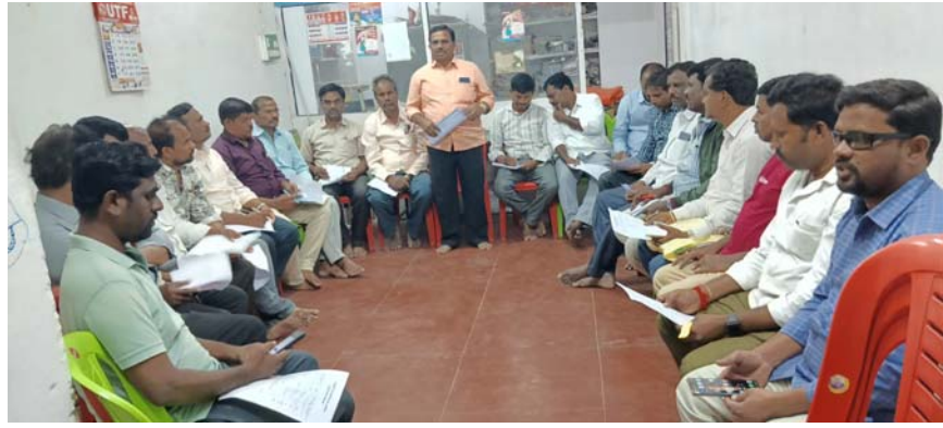
కర్నూలు జిల్లా ఉత్తేజిత ప్రతినిధి