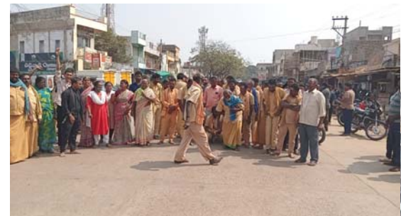
నందికొట్కూరు, ఉత్తేజిత ప్రతినిధి, ఫిబ్రవరి.04

నందికొట్కూరు పట్టణంలోని మారుతి నగర్లో బుధవారం ఉద్రిక్త పరిస్థితులు నెలకొన్నాయి. చర్చి వద్ద వినిపించే శబ్దం (సౌండ్) తగ్గించే విషయంపై రెండు వర్గాల మధ్య మాటామాటా పెరిగి గొడవకు దారితీసినట్లు సమాచారం. ఈ గొడవలో ఒక శివ స్వామిపై దాడి జరిగిందని ఆయన అనుచరులు ఆరోపిస్తున్నారు. చిన్న వివాదంగా ప్రారంభమైన విషయం క్రమంగా పెద్దదిగా మారి వివరకు పోలీస్ స్టేషన్ వరకు చేరింది. ఘటనపై ఇరు వర్గాల వరసరం ఆరోపణలు చేసుకుంటూ పోలీసులకు ఫిర్యాదులు చేసినట్లు తెలిసింది.