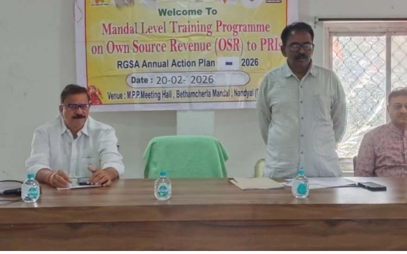
బోధించే ఉత్తేజం ప్రతినిధి