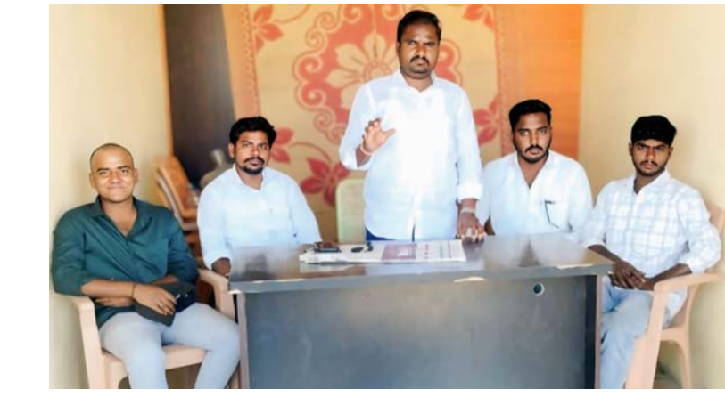
చర్యలు తీసుకోవడంలో మండల జిల్లా విద్యాధికారులు వైఫల్యం కౌతాళం ఉత్తేజం న్యూస్