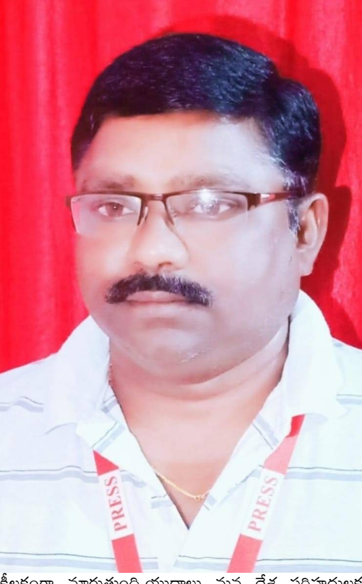
కీలకంగా మారుతుంది. యుద్ధాలు మన దేశ సరిహద్దులకు దూరంగా ఉన్నా... వాటి ఆర్థిక షాక్ వేవ్ మన ఇంటి వరకు వస్తాయి. ఇది కేవలం ఆర్థిక సమస్య కాదు, లక్షల కుటుంబాల జీవనం, దేశ అభివృద్ధి మార్గంపై ప్రభావం చూపుతుంది. వీటన్నిటికీ ఒక్కటే పరిష్కారం... ఒక దేశ సార్వభౌమాధికారం విషయంలో మరో దేశం జోక్యం చేసుకోవద్దు. ఇతర దేశాలతో స్నేహపూర్వక ఒప్పందాలు కొన సాగాలి. అప్పుడే ప్రపంచం శాంతి వర్ధిల్లి, స్థిరమైన ప్రపంచ అభివృద్ధికి మార్గం పడుతుంది.