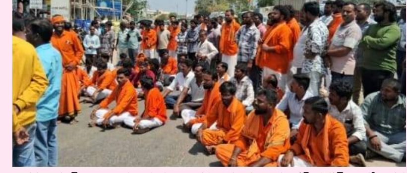
ఎడవల్లి మార్చి 11 వార్త నిర్ణయం : ఎడవల్లి మండలం మంగళ్ పహాడ్ చౌరస్తా వద్ద బుధవారం హనుమాన్ మాలదారులు రాస్తారోకో చేపట్టారు. మంగళ్ పహాడ్ ప్రభుత్వ పాఠశాలలో హనుమాన్ మాల ధారణ చేసిన విద్యార్థి పై పాఠశాల ఉపాధ్యాయుని చేసిన వ్యాఖ్యలు హిందువుల మనోభావాలు దెబ్బతీసే విధంగా ఉన్నాయని ఆరోపిస్తూ హనుమాన్ దీక్షాపరులు పాఠశాల గేట్ వద్ద నిరసన తెలిపారు. అనంతరం మంగళ్ పహాడ్ చౌరస్తా వద్ద రాస్తా రోకో చేపట్టారు. ఘటన స్థలానికి ఎన్ఫై ముఖ్యాల రమ చేరుకొని పరిస్థితిని సమీక్షించారు.